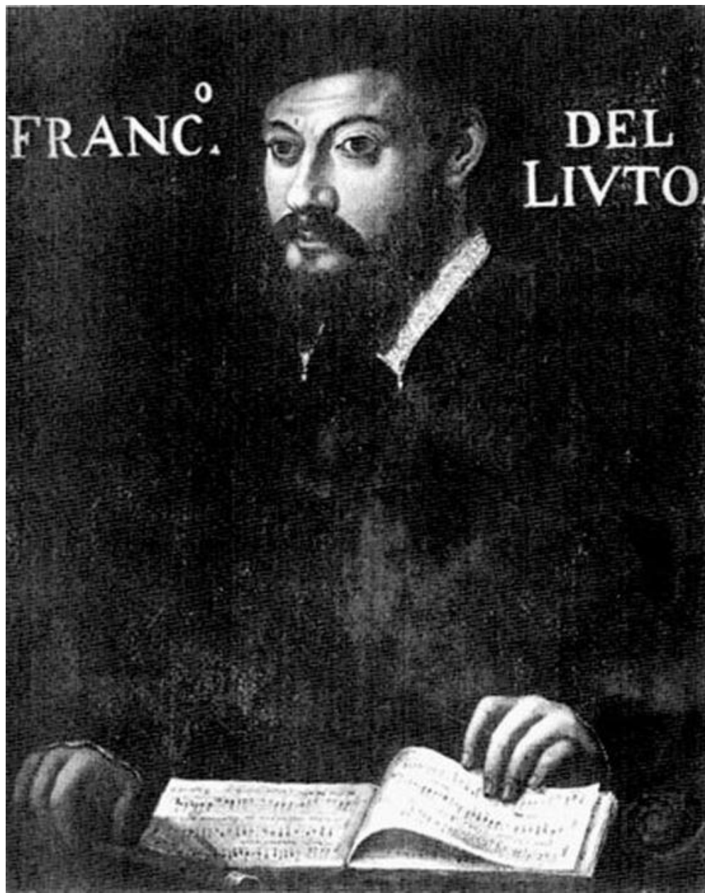
Франческо Канова да Милано (1497-1543)