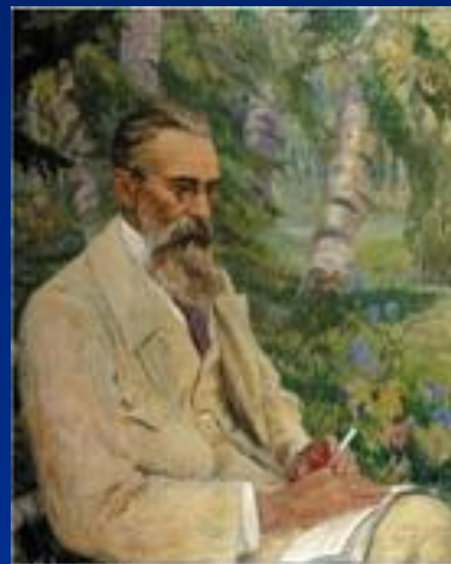
Ушаков А. Портрет Римского-Корсакова Н.А.

Композитор в своей музыке использовал русские былины, легенды и исторические предания