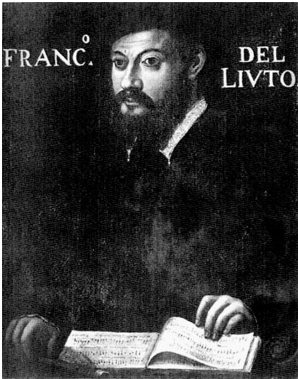
Франческо Канова да Милано (1497-1543)