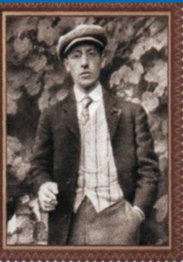
И. Ф. Стравинский (1882–1971)

- русский композитор. Он родился в Петербурге, в семье известного певца. Музыкальная обстановка в семье, встречи с выдающимися музыкантами, знакомство с богатой библиотекой отца, посещение оперного театра - всё это способствовало раннему увлечению мальчика музыкой. К 10 годам он хорошо играл на рояле и начал сочинять музыку. Занятия в юношеские годы с Н. А. Римским-Корсаковым завершили музыкальное образование И. Стравинского. Долгие годы И. Стравинский жил в США, но всегда оставался русским композитором.