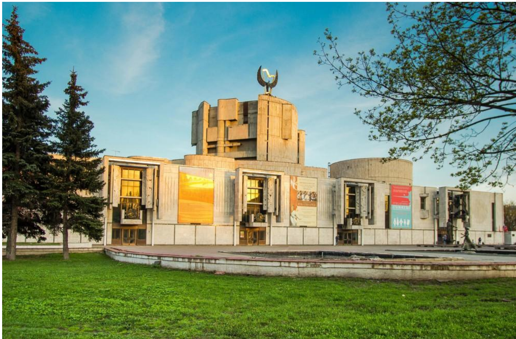
Детский музыкальный театр 1964 год