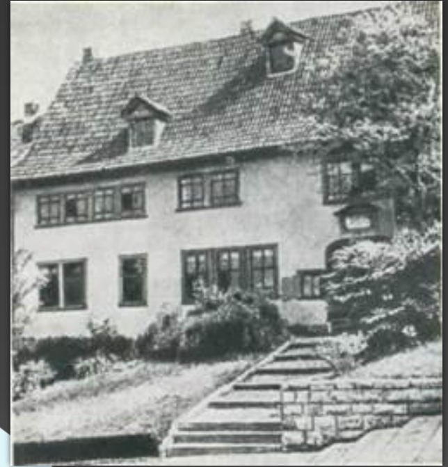
Дом композитора в Эйзенахе.