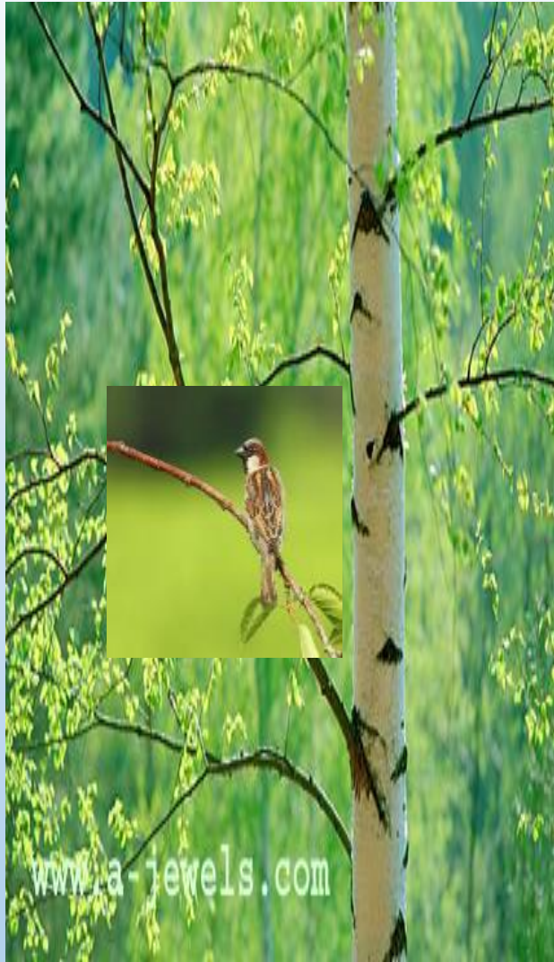
Воробей с берёзы чирик