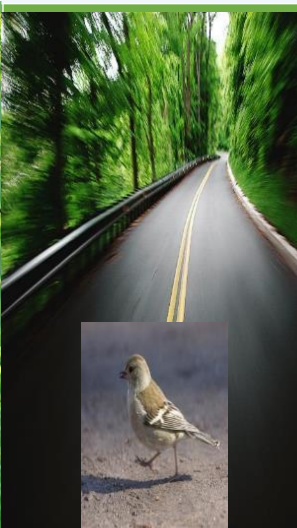
на дорогу прыг