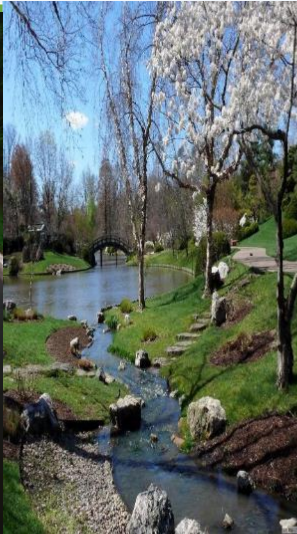
больше нет мороза