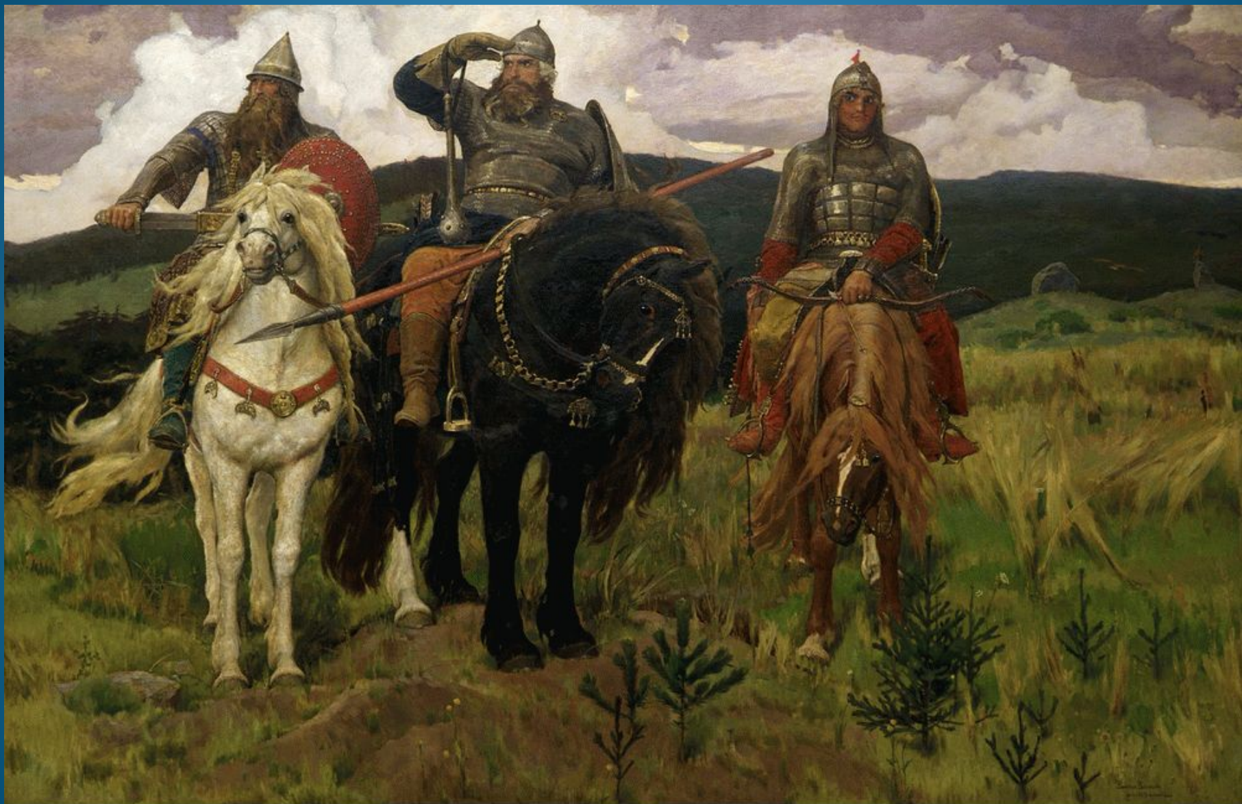
В.М.Васнецов. "Богатыри". 1881-1898 гг. Гос. Третьяковская галерея