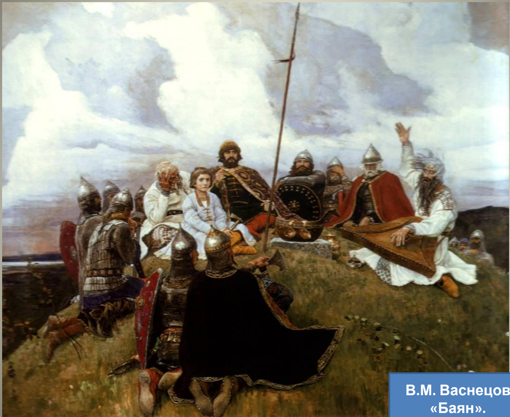
В.М. Васнецов «Баян».