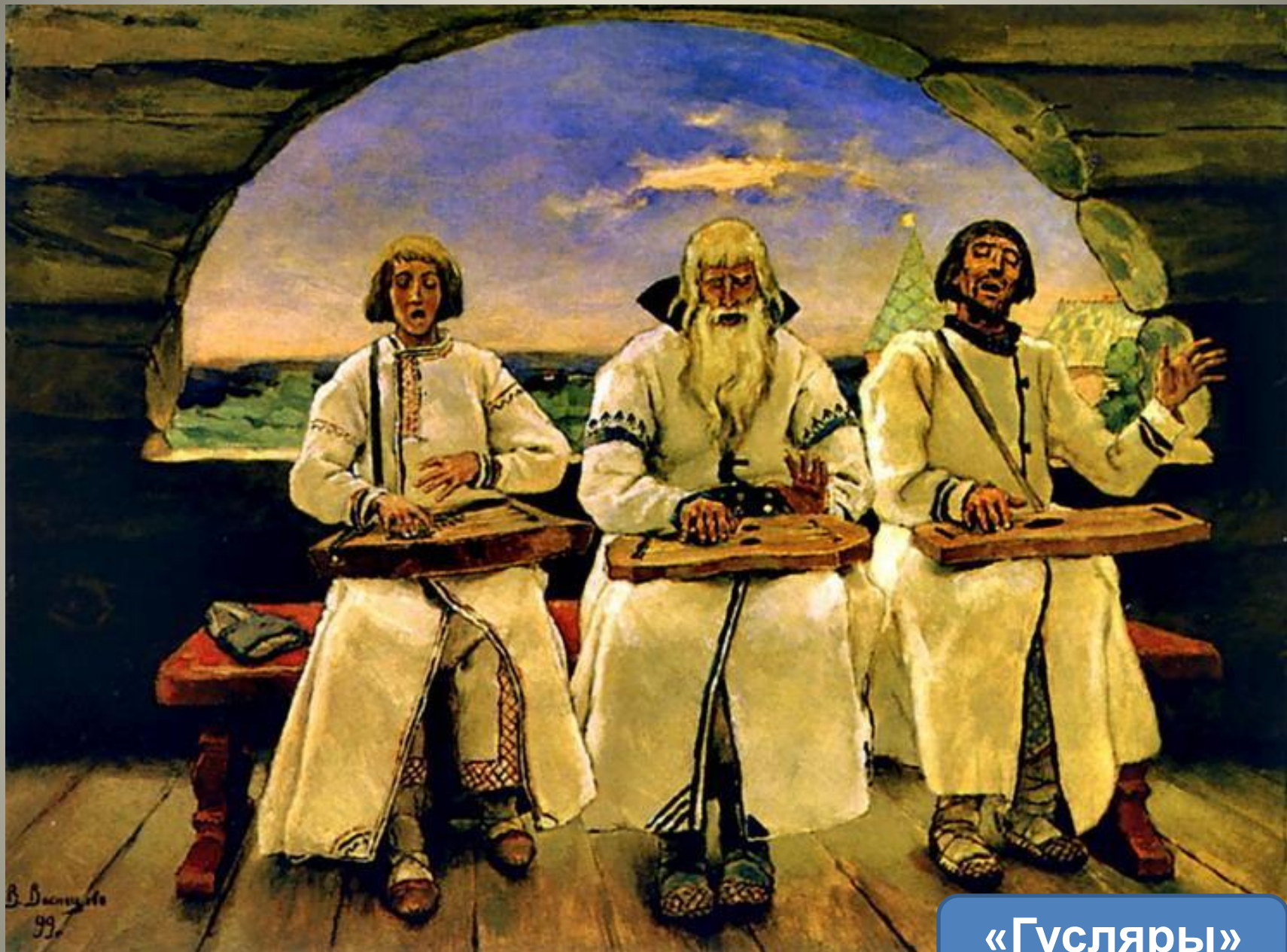
«Гусляры» В. М. Васнецов