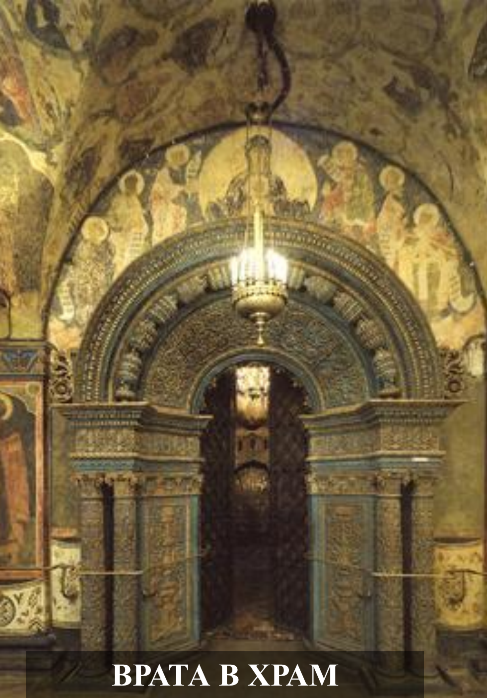
ВРАТА В ХРАМ

Вот уже две тысячи лет воспевается образ Божией матери. Богородице посвящают свои творения художники и скульпторы, поэты и композиторы. Недаром среди многих обращений к Богородице - Дева Мария, Царица Небесная, Мадонна - есть обращение - Всепетая.