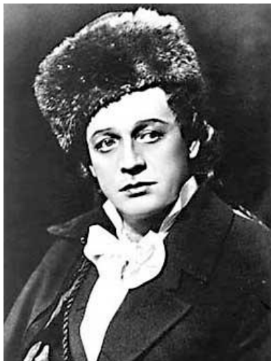
Лучший исполнитель на советской сцене Большого театра партии Ленского опера «Евгений Онегин» Чайковского (1972г.)