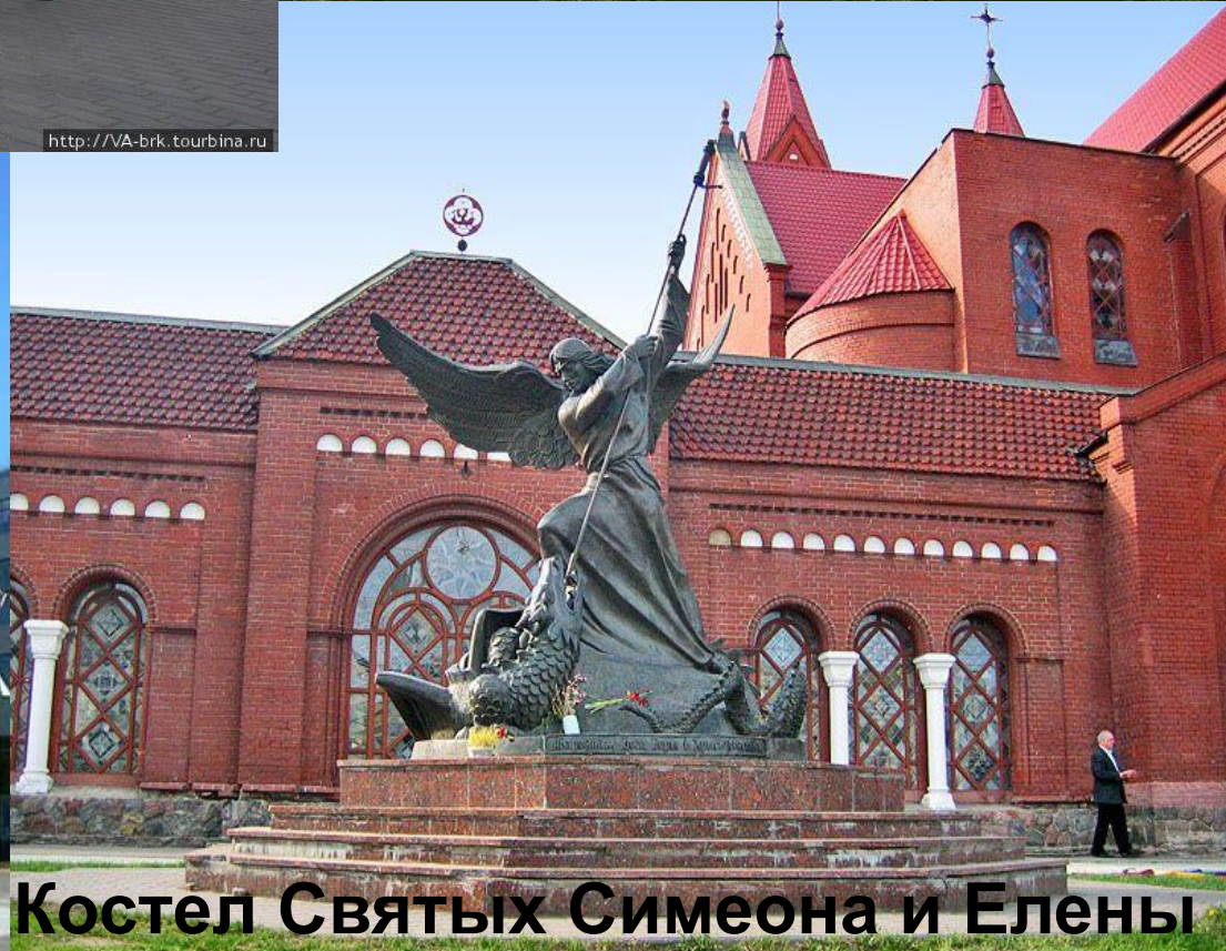
Костел Святых Симеона и Елены