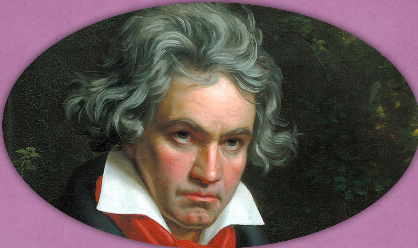
Людвиг ван Бетховен