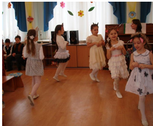
Козлята на лужайке ждут маму Козу