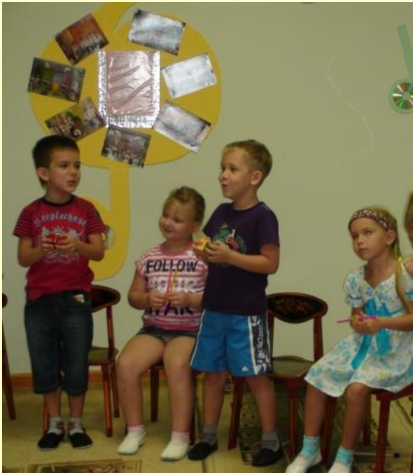
Мальчики озвучивают кубиками «корову»