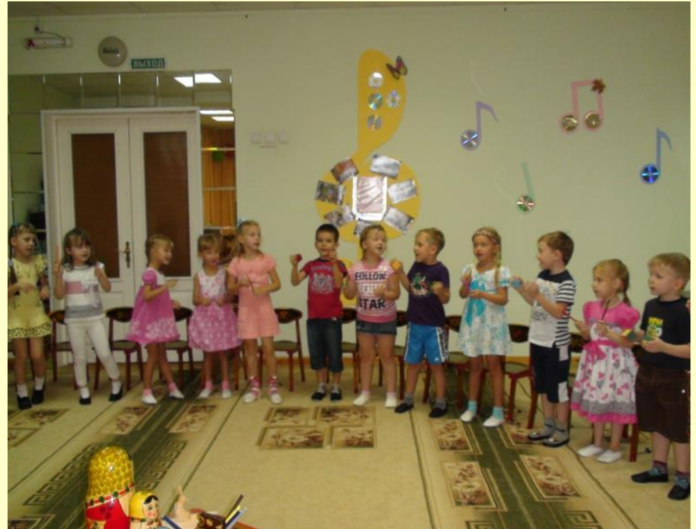
Девочки озвучивают карандашами «синичек»