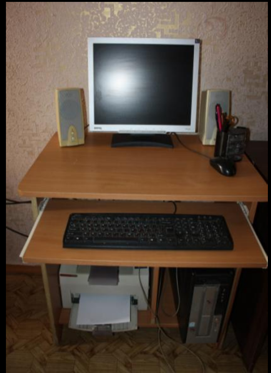
1.7. Рабочий сектор (ИКТ для педагога)

В кабинете музыкального руководителя имеется в большом количестве методическая литература, которая постоянно пополняется новинками. Также нами собраны и оформлены в разнообразные тематические папки. Методическая копилка музыкальных руководителей включает в себя богатейшую фонотеку, как классики, так и музыки современных композиторов, песен для детей; видеотеку балетов-сказок П.И. Чайковского, опер для детей, выступлений выдающихся музыкантов. А недавно, был создан мини-музей грампластинок, где дети с удовольствием слушают музыку, записанную на виниловые диски. Дошколята воспринимают окружающий мир через наглядность и эмоции, поэтому в процессе музыкальной деятельности используются самые разнообразные атрибуты, что очень важно и увлекательно для детей.