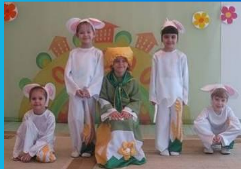
танец «Солнечные зайчики»