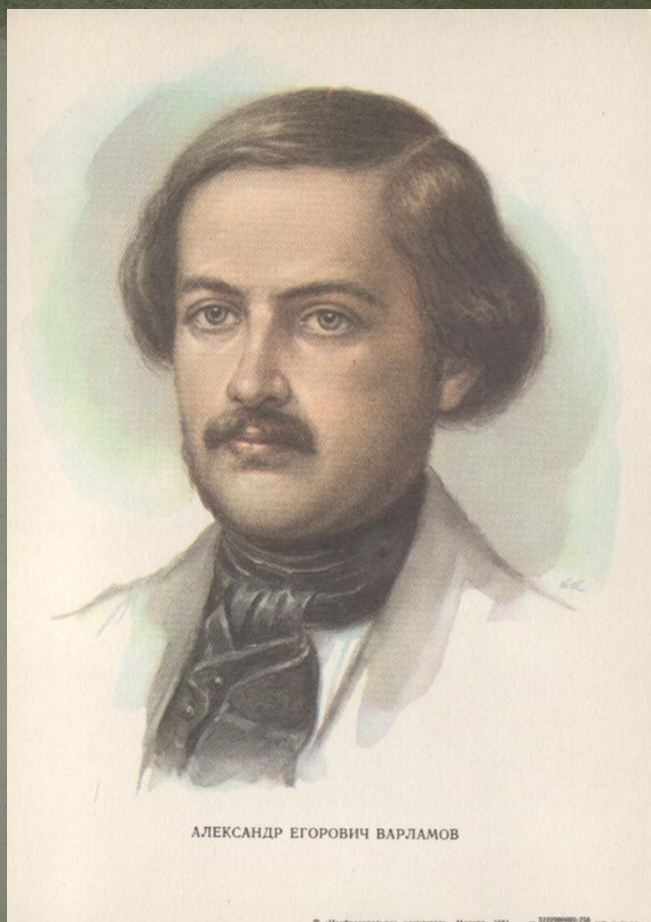
АЛЕКСАНДР ЕГОРОВИЧ ВАРЛАМОВ