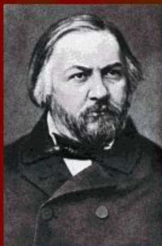
М. И. Глинка