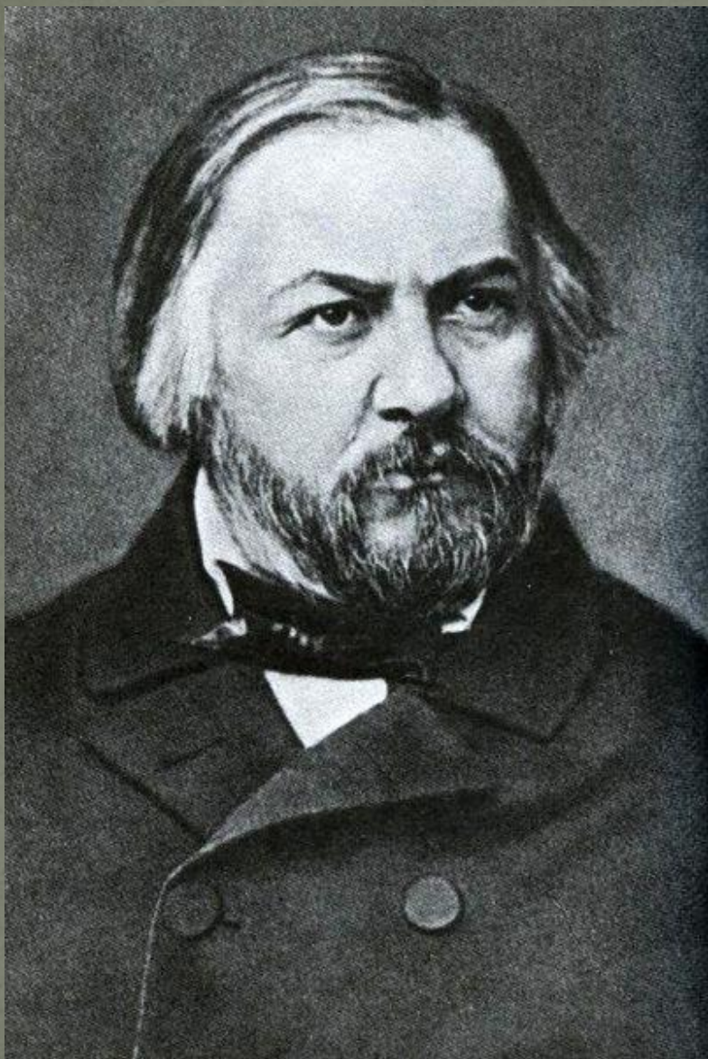
Михаил Иванович Глинка