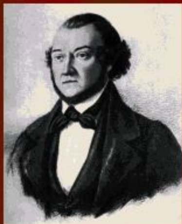
А. А. Алябьев