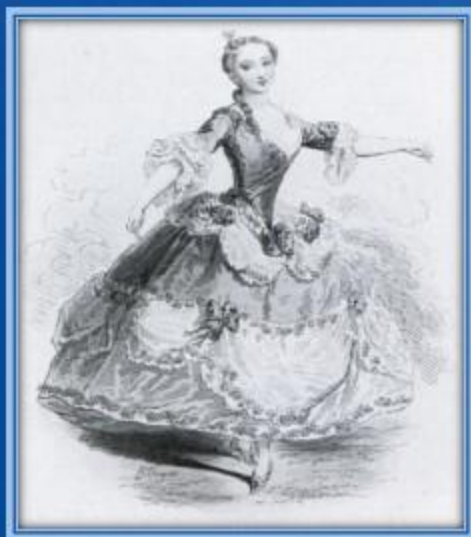
Первые платья балерин

Балет придумали в Италии – хотя таким, как сейчас, он стал во Франции. Сначала балет танцевали во дворцах в длинных платьях и использовали маски. Но в длинных платьях с кринолином, туфлях на каблуке и высоких париках было очень не удобно танцевать, поэтому позже танцовщицы укоротили свои юбки, теперь они носили пачки-шопенки – длинные пышные юбки из легкого тюля. Постепенно юбки стали все короче и жестче, и в конце концов появилась классическая пачка , торчащая в стороны. Совсем юные танцовщики, которые делают первые шаги и учатся овладевать движениями, занимаются в эластичных купальниках, они дают необходимую свободу движений. Под купальником носят белые колготки, которые плотно прилегают к ноге.