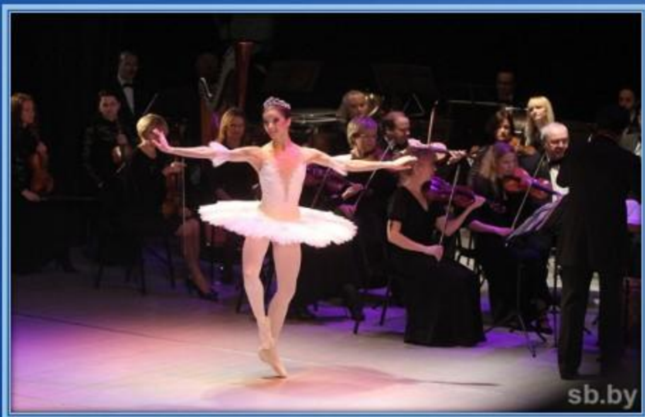
Балерина и симфонический оркестр

Над балетом работает целый коллектив: композитор – пишет музыку, сценарист – пишет либретто (Либрétто — литературная основа большого вокального (и не только) сочинения, например, оперы, балета, оперетты; краткое содержание сюжета спектакля). Музыка неотъемлемая часть балета, которую исполняет симфонический оркестр. А руководит им дирижер.