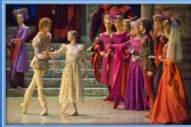
«Ромео и Джульетта»