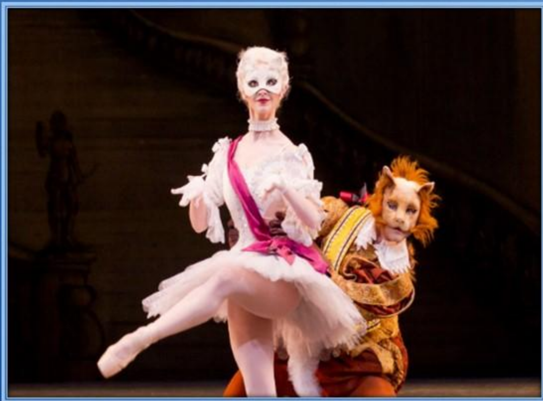
«Кот в сапогах»