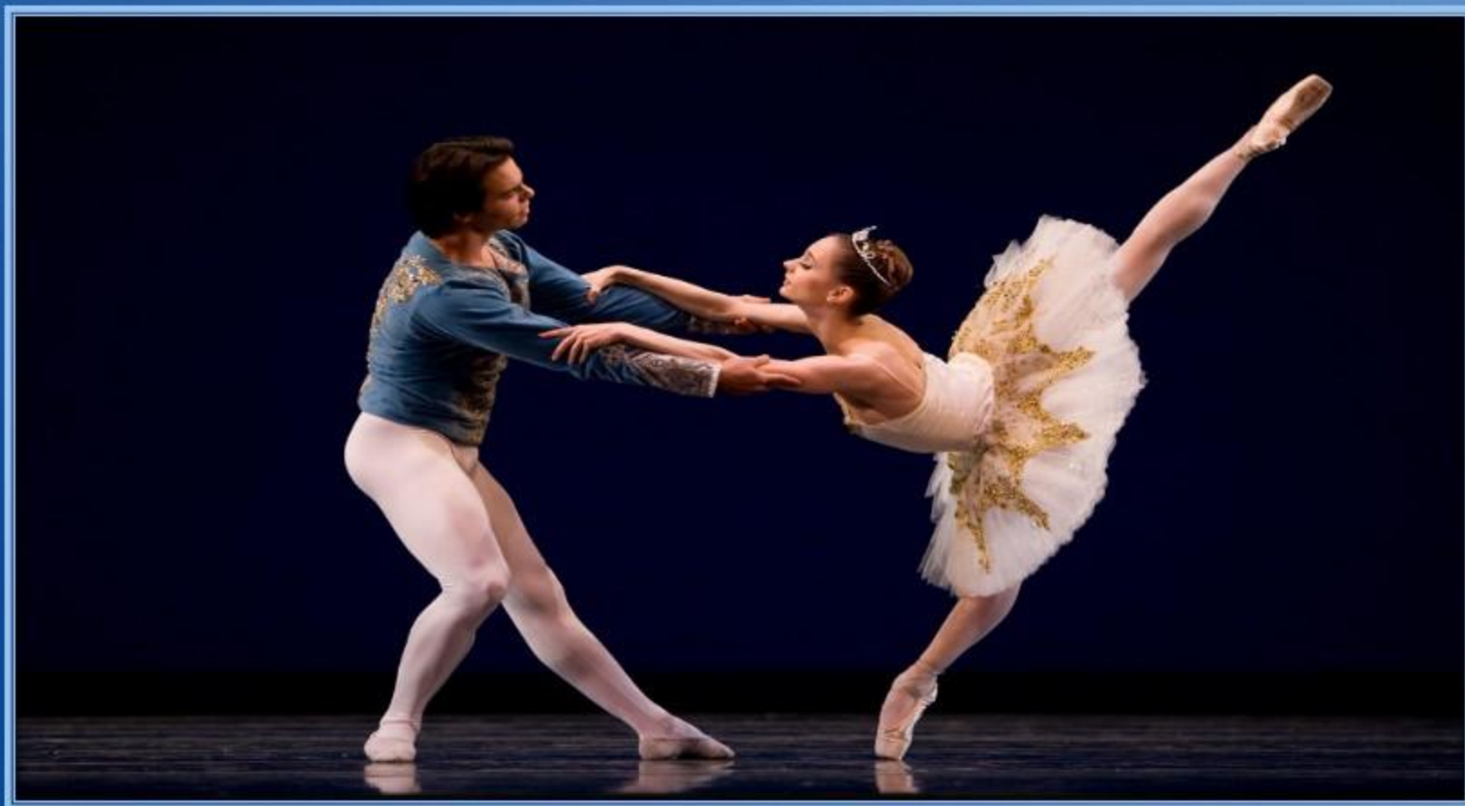
Танцор и балерина

Танцоры должны носить короткие прически. У балерин длинные волосы склоты сзади в пучок, чтобы подчеркнуть красивую линию головы и шеи.