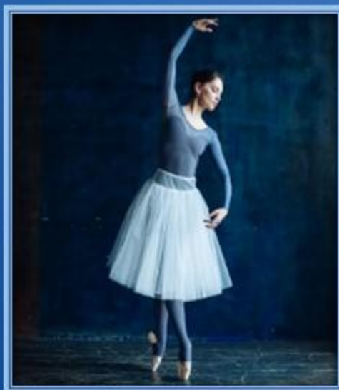
Пачка - шопенка