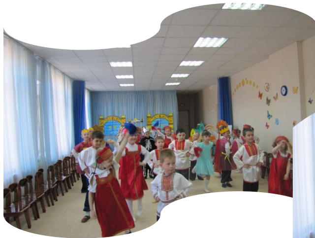
Празднует честной народ