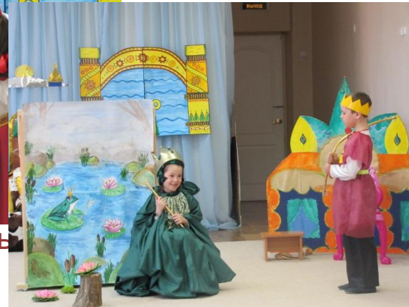
Я- судьба твоя, поверь!