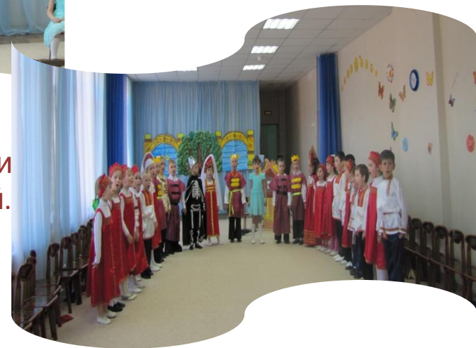
Жизнь театр и все мы в ней актёры