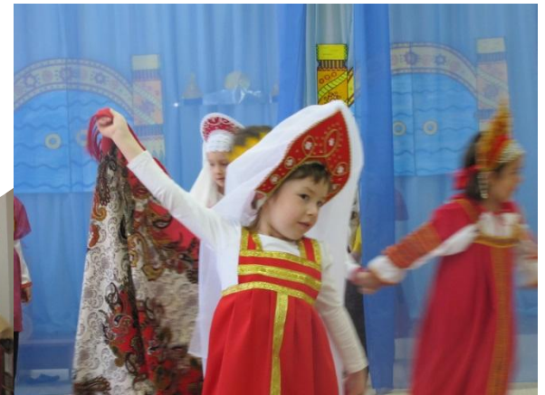
Василиса-словно лебедь белая плывёт.