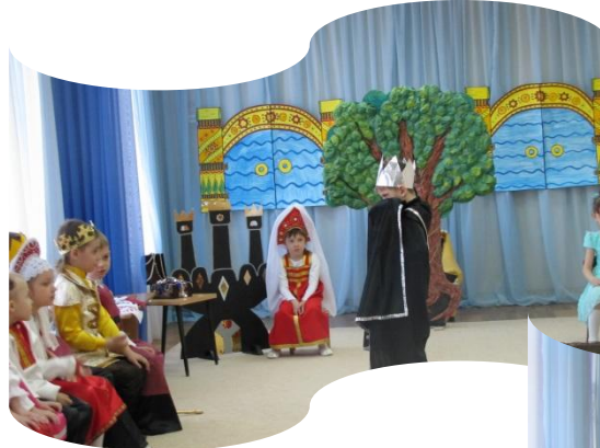
Что ты всё тоску наводи -вопрошает наш Кощей.