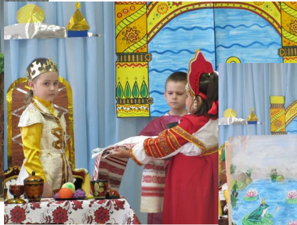
Вот боярская дочь рукоделье несёт.