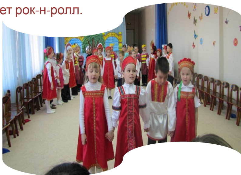
И замер зал в аплодисментах.