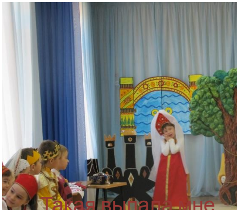
Такая выпала мне доля...