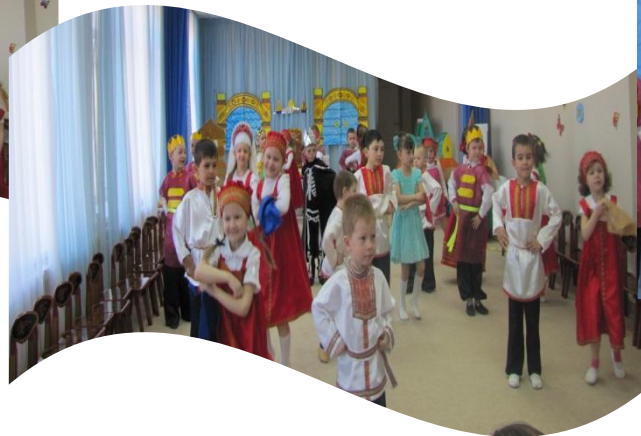
Вот он пир на весь мир!