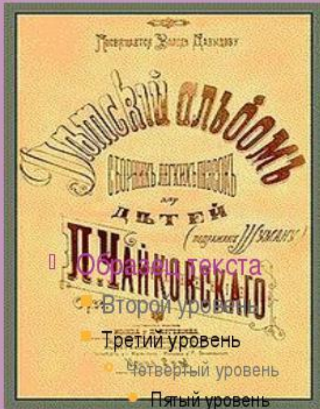
Обложка первого выпуска нот «Детского альбома»