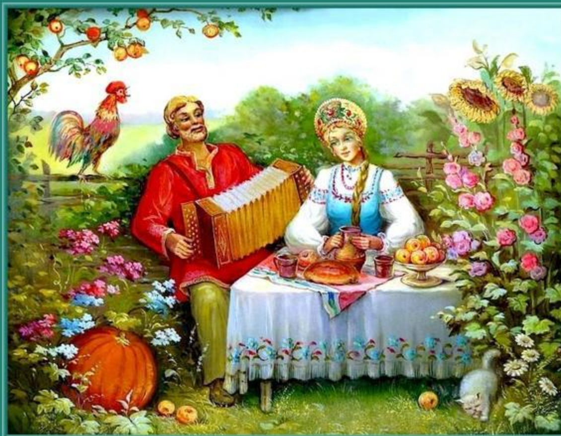
П. Чайковский. «Камаринская»