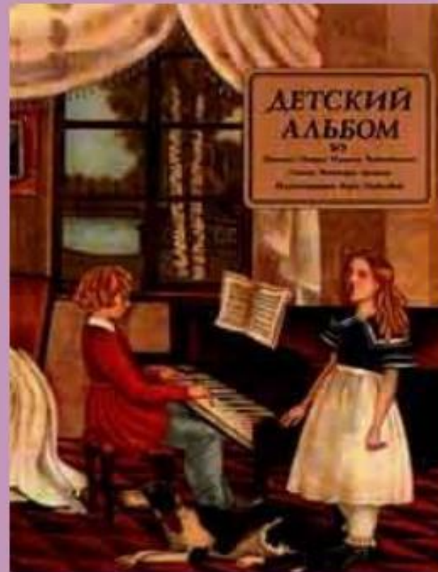
Обложка выпуска нот 1976 г.