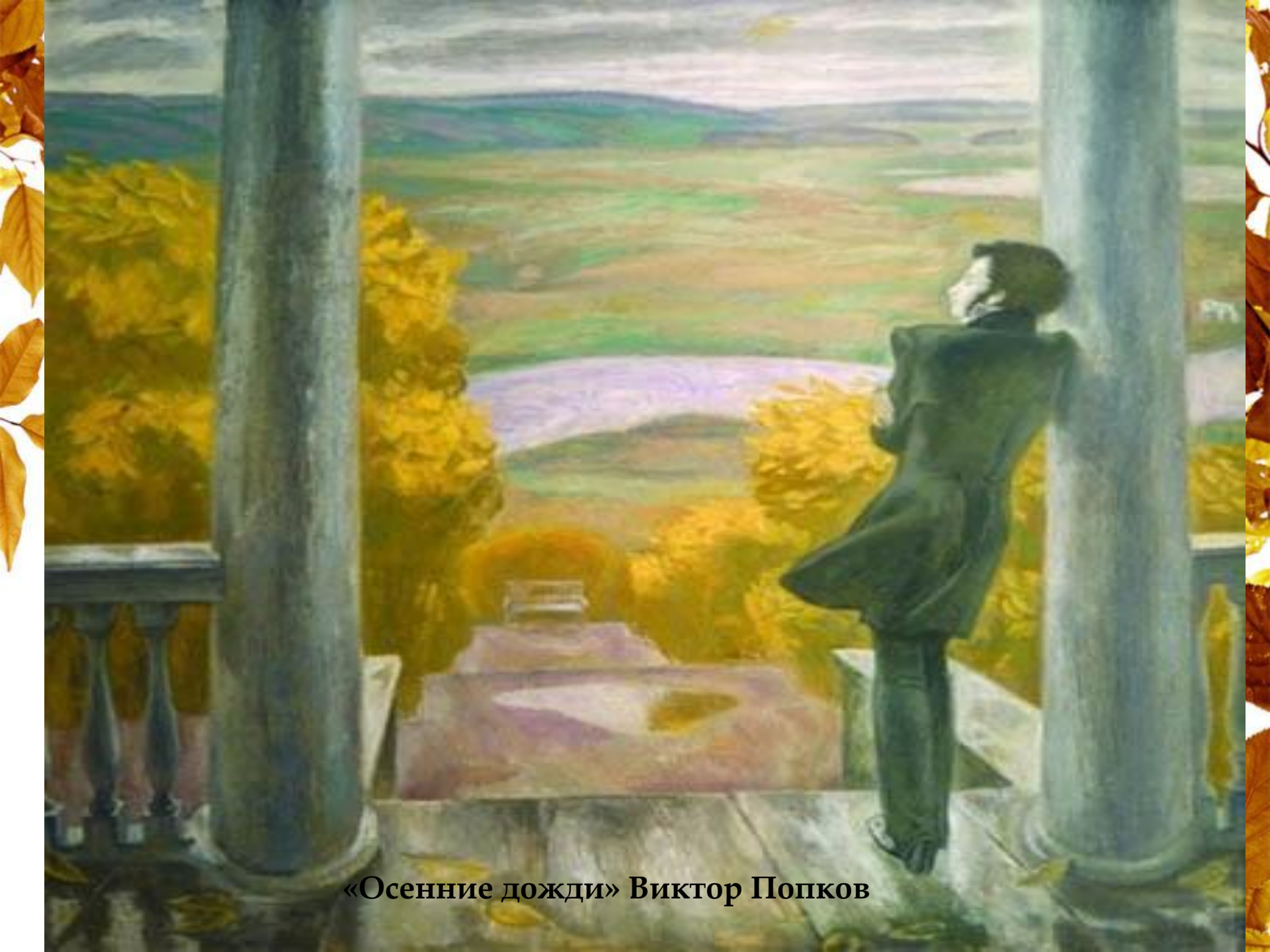
«Осенние дожди» Виктор Попков