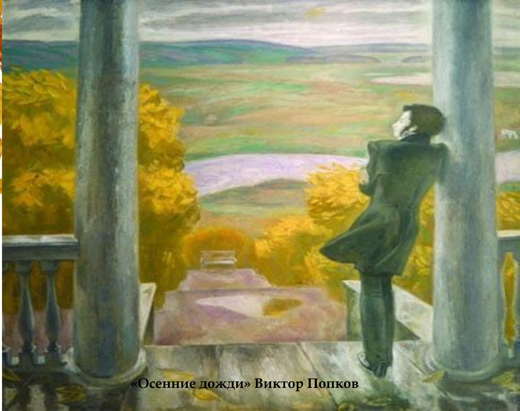
«Осенние дожди» Виктор Попков