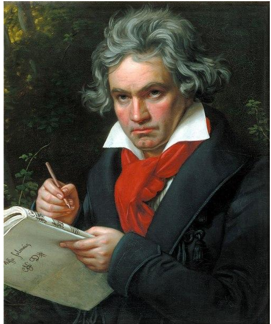
Л. В. Бетховен