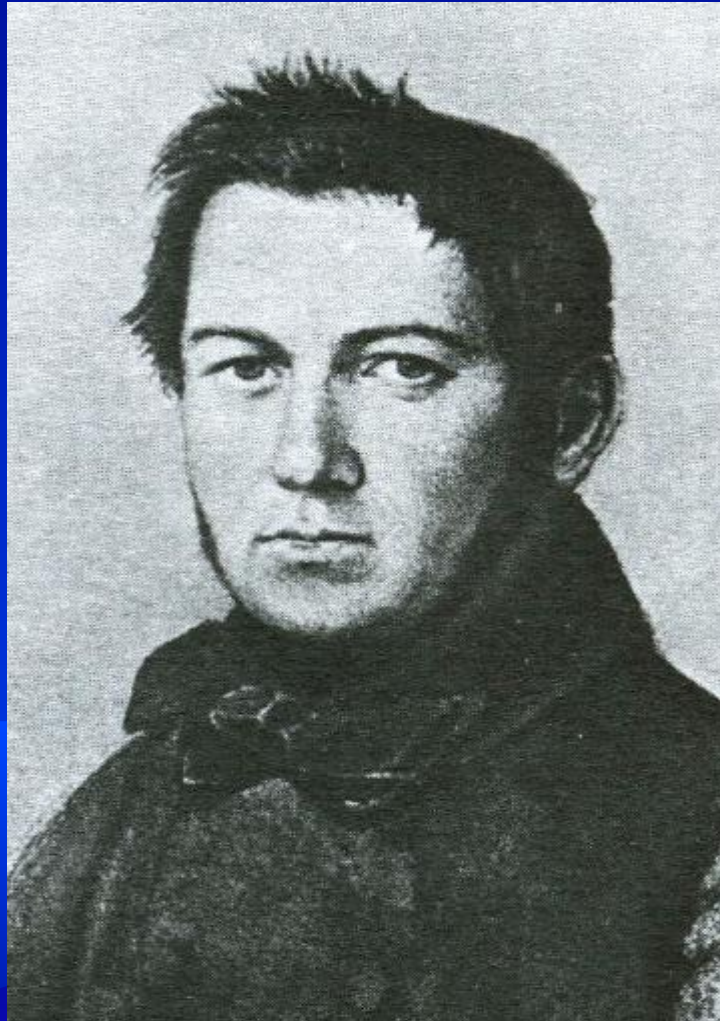
М.И. Глинка, портрет 1840г.