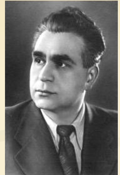
Нэлепп Георгий Михайлович (1904 – 1957 г.г.)

советский оперный певец, актер большой сценической культуры.