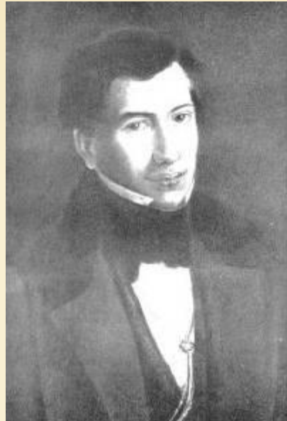
Кукольник Нестор Васильевич

русский композитор, родоначальник русской классической музыки.