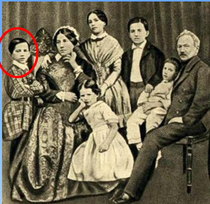
Семья Чайковских в 1848 году (крайний слева — Пётр Ильич)

Родился 25 апреля 1840 года в селении при Камско - Воткинском заводе Вятской губернии (ныне город Воткинск, Удмуртия). Пётр был вторым ребёнком в семье.