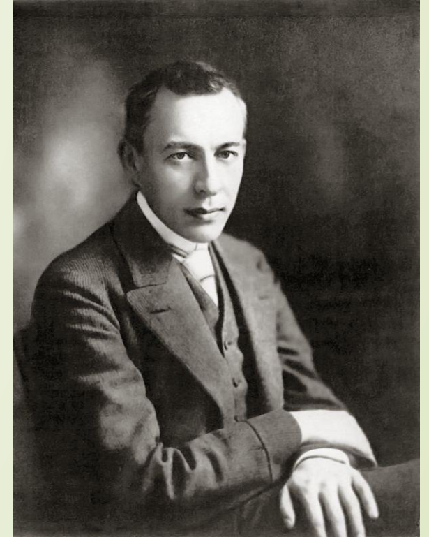
Молодой Рахманинов в 1901 году