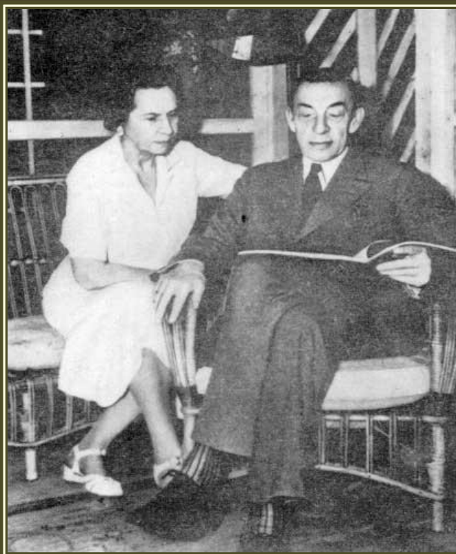
Наталья Александровна и Сергей Васильевич Рахманиновы на даче в Бeverли-Хиллс (1942)