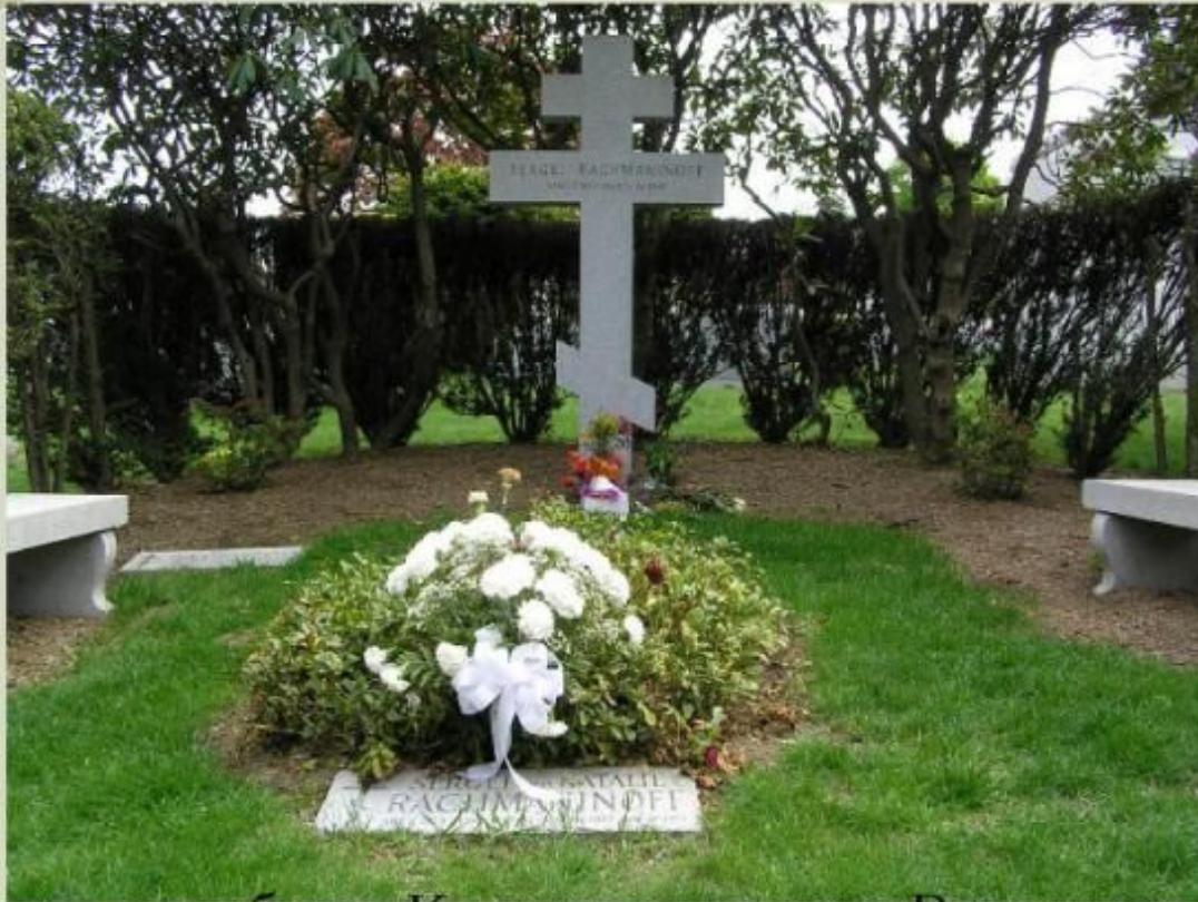
кладбище Кенсико в городке Валхалла штат Нью-Йорк PPT4WEB.ru