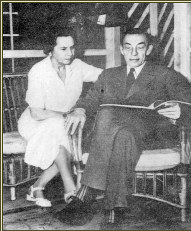
Наталья Александровна и Сергей Васильевич Рахманиновы на даче в Бeverли-Хиллс (1942)