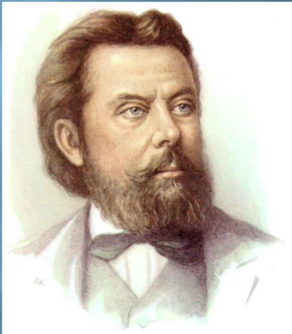
Модест Петрович Мусоргский