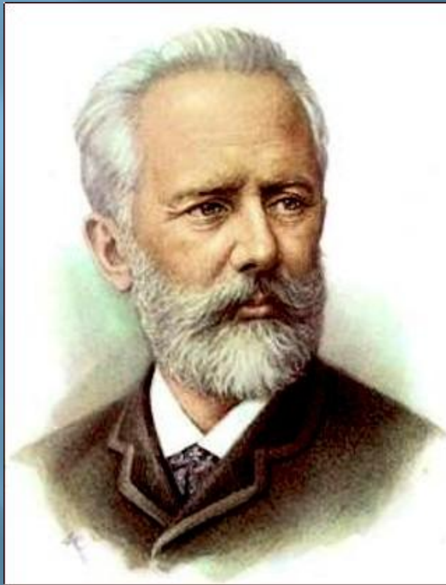
Петр Ильич Чайковский