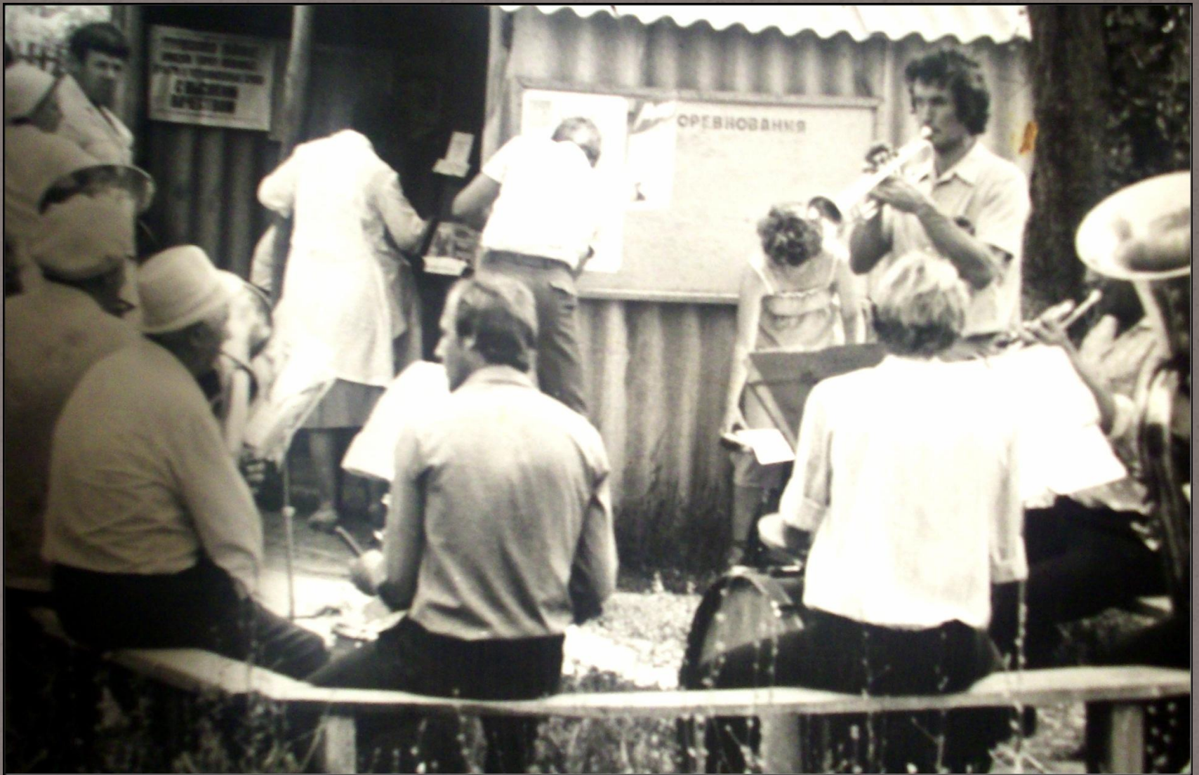
Самодеятельный духовой оркестр