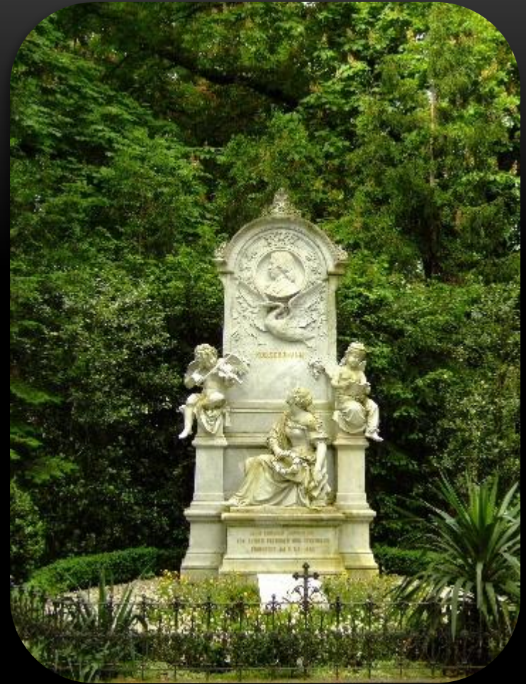
Могилы Роберта и Клары Шуман