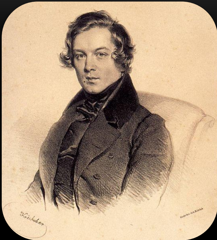
Роберт Шуман, Вена, 1839

Интеллектуал и эстет, в своей музыке Шуман больше, чем любой другой композитор, отразил глубоко личностную природу романтизма. Его ранняя музыка, интроспективная и зачастую причудливая, была попыткой порвать с традицией классических форм и структур, по его мнению, слишком ограниченных. Во многом родственное поэзии Г. Гейне, творчество Шумана бросало вызов духовной убогости Германии 1820-х — 1840-х годов, звало в мир высокой человечности. Наследник Ф.