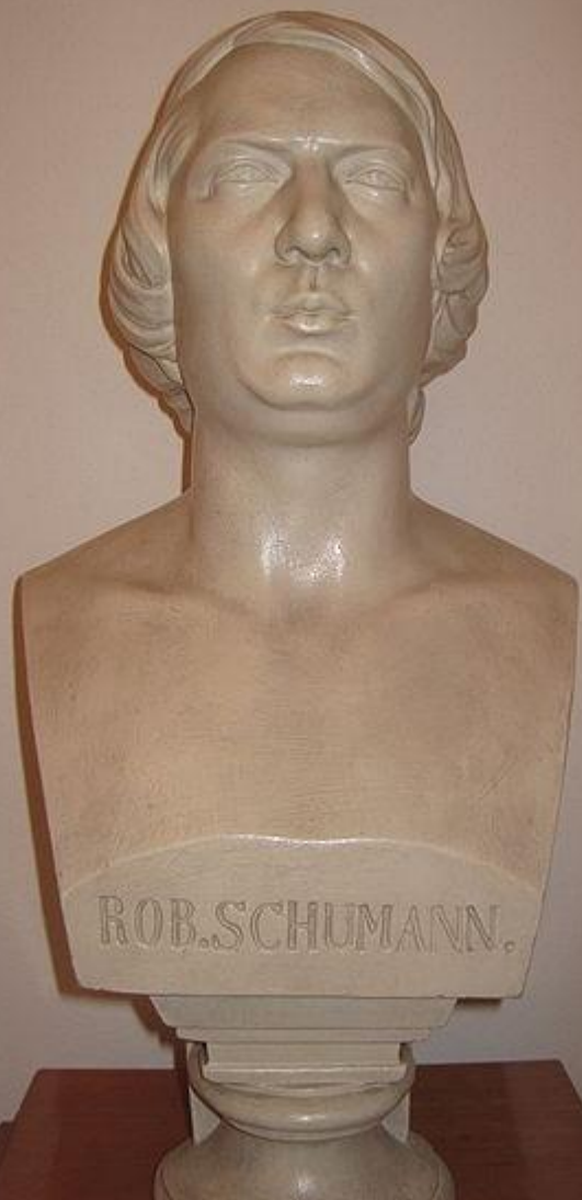
Бюст Роберта Шумана

http://ru.wikipedia.org/wiki/%D8%F3%EC%E0%ED,_%D0%EE%E1%E5%F0%F2