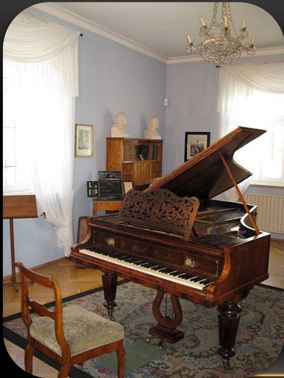
Музыкальная комната композитора в музее Шумана в Цвиккау

В 1828 году он поступил в Лейпцигский университет, а в следующем году перешёл в университет Гейдельберга. Он по настоянию матери планировал стать юристом, но музыка всё больше затягивала юношу. Его влекла идея стать концертирующим пианистом. В 1830 году он получил разрешение матери полностью посвятить себя музыке и вернулся в Лейпциг, где надеялся найти подходящего наставника. Там он начал брать уроки фортепиано у Ф. Вика и композиции у Г. Дорна. Стремясь стать настоящим виртуозом, он занимался с фанатичным упорством, но именно это и привело к беде: форсируя упражнения с механическим устройством для укрепления мышц руки, он повредил правую руку. Средний палец перестал действовать и, несмотря на длительное лечение, рука навсегда сделалась неспособной к виртуозной игре на фортепиано. Мысль о карьере профессионального пианиста пришлось оставить. Тогда Шуман серьёзно занялся композицией и одновременно музыкальной критикой. Найдя поддержку в лице Фридриха Вика, Людвига Шунке и Юлиуса Кнорра, Шуман смог в 1834 году основать одно из влиятельнейших в дальнейшем музыкальных периодических изданий — «Новую музыкальную газету» (нем. Neue Zeitschrift für Musik ), которое на протяжении нескольких лет редактировал и регулярно публиковал в нём свои статьи. Он зарекомендовал себя приверженцем нового и борцом с отжившим в искусстве, с так называемыми филистерами, то есть с теми, кто своей ограниченностью и отстапостью тормозил