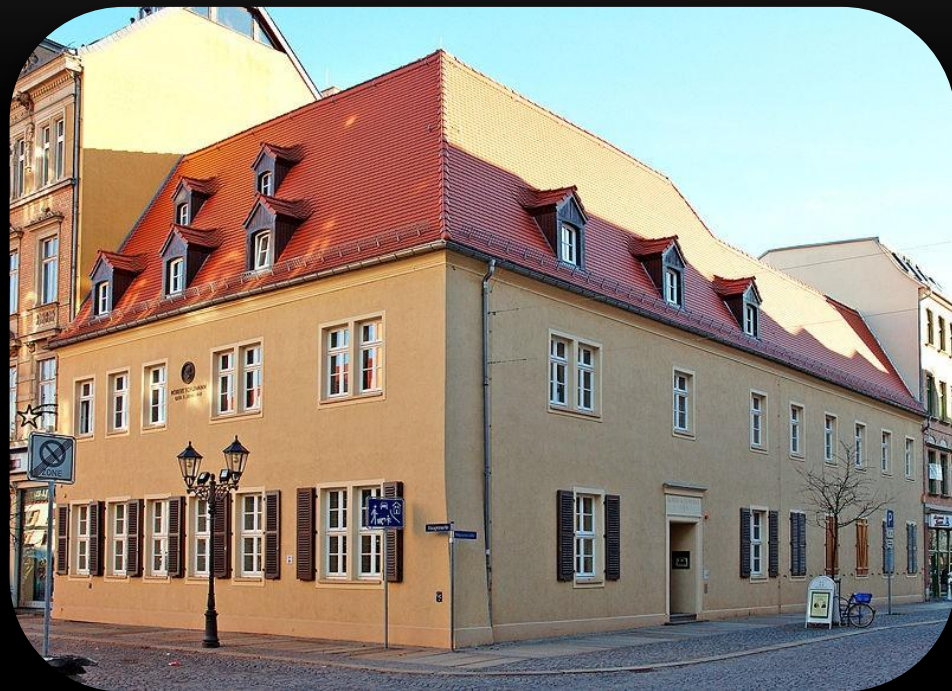
Дом Шумана в Цвиккау