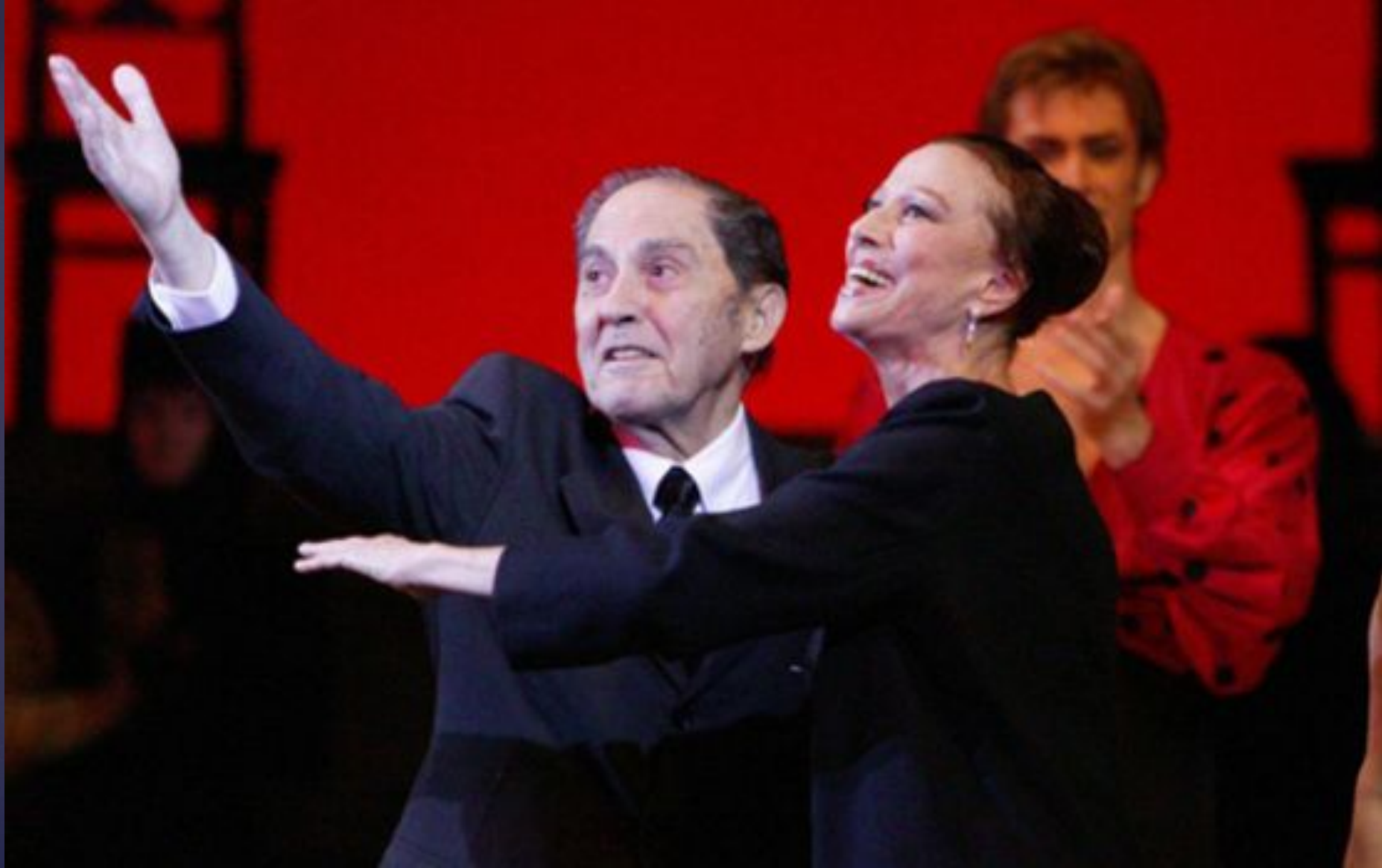
М. Плисецкая и А. Алонсо