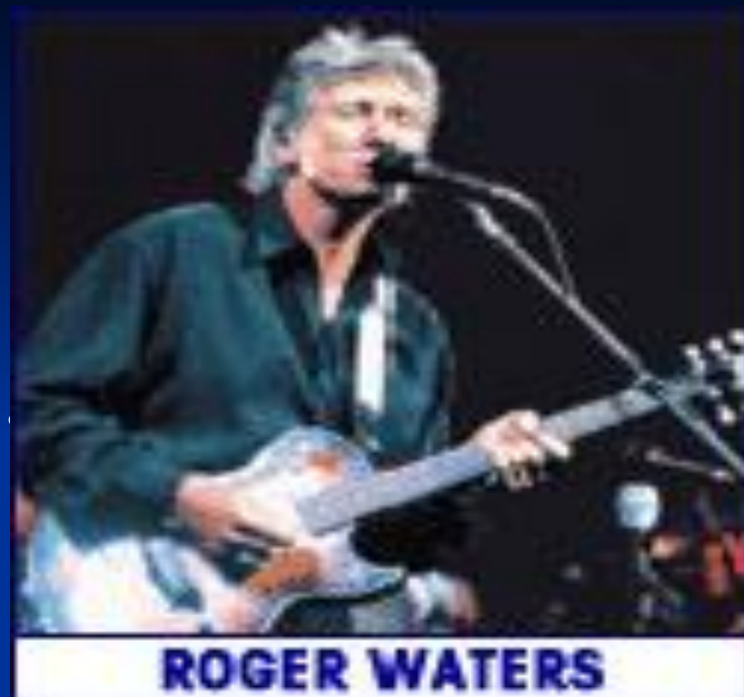
Джордж Роджер Уотерс