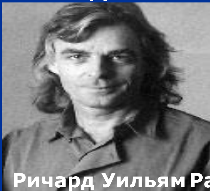
Ричард Уильям Райт