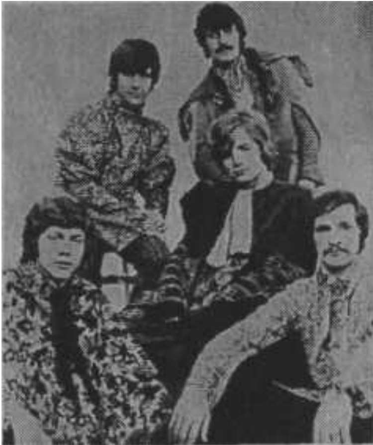
британская группа «Moody Blues»

Арт-рок берет своё начало в среде лондонского андерграунда второй половины 1960-х гг., в недрах британской психоделики с её интересом ко всему интеллектуальному, философскому, утонченному, экспериментаторскому