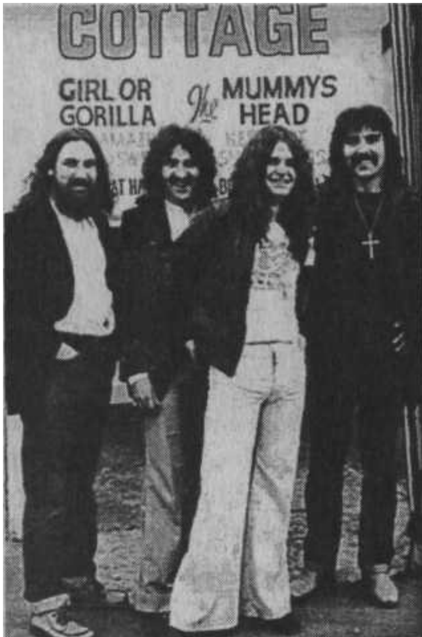
Ранний состав Black Sabbath

Приблизительно в то же время в рамках хард-рока стали появляться и стилевые разновидности, обладавшие некоторой долей самостоятельности.