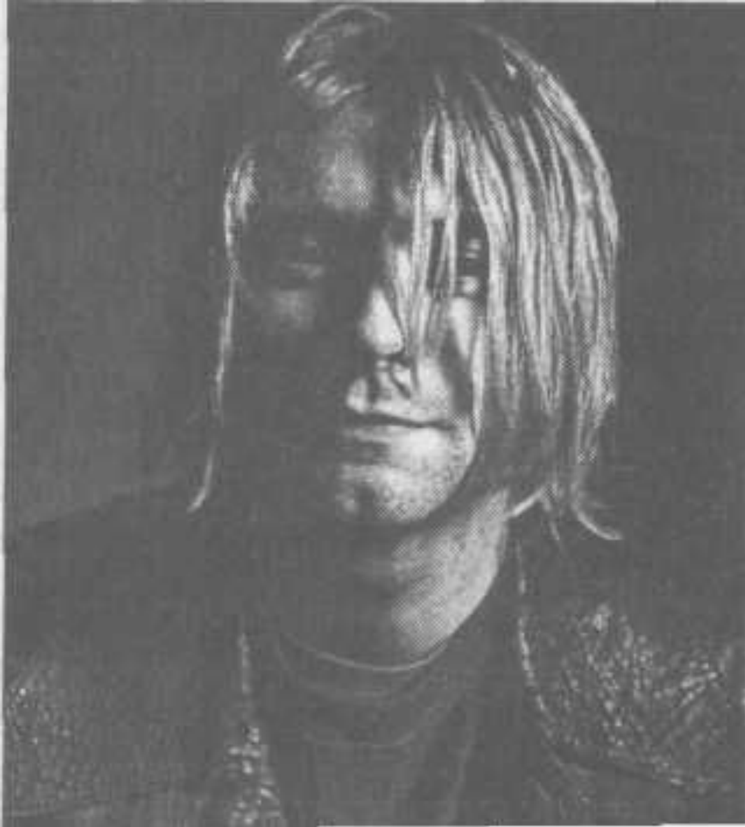
Курт Кобейн («Nirvana»)