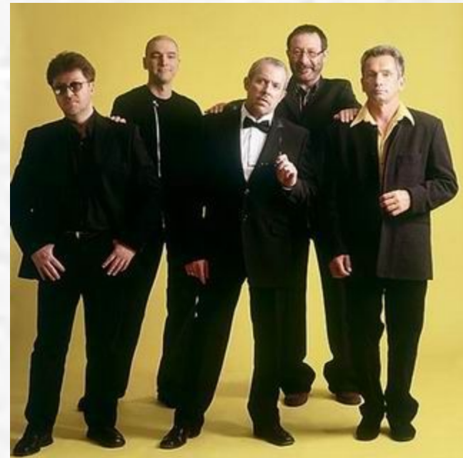
Машина времени - костер

В 1999 году группа отпраздновала свое 30-летие.