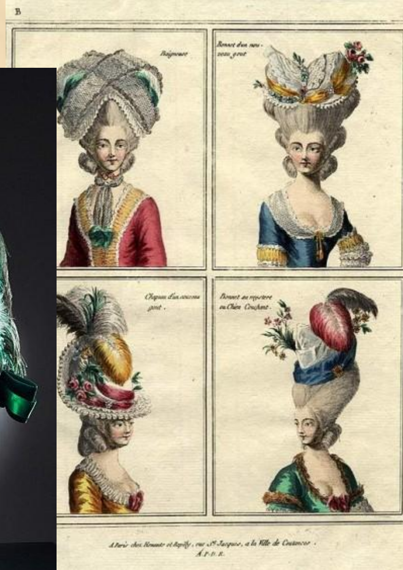
A Paris chez Madame et Apollon, rue St. Jacques, a la Ville de Commerce. A.P.R.