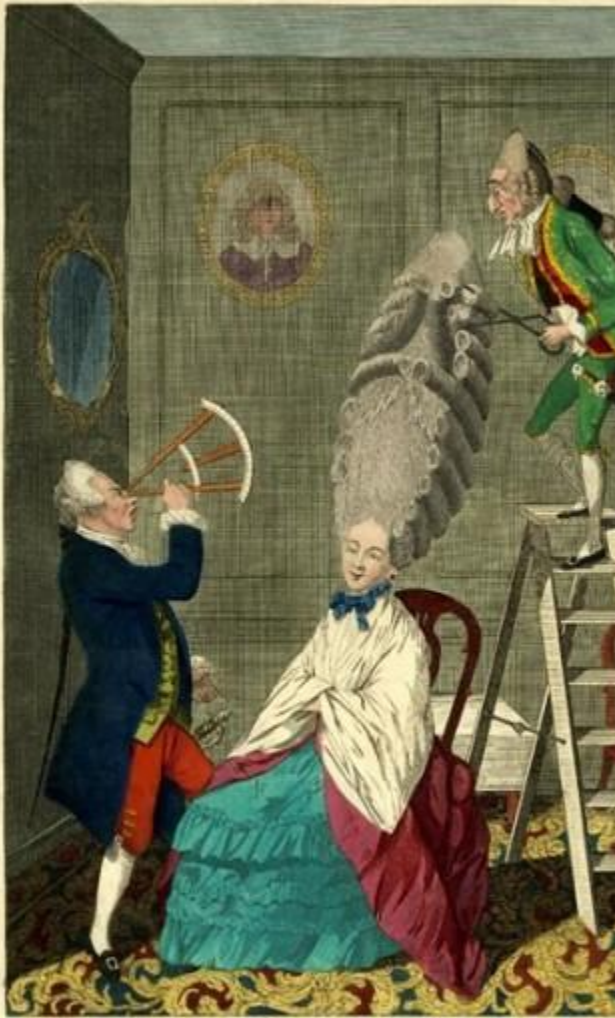
RIDICULOUS TASTE ON THE LADIES' ABURD

Printed by W. Woodcut, in the Strand, at the Sign of the Golden Ship, near St. Dunin's Church.