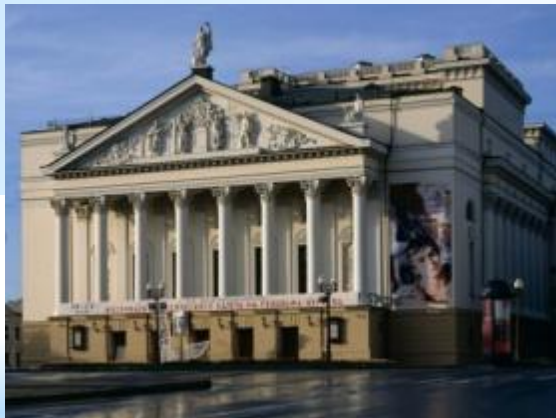
Большой оперный театр

Русская опера внесла ценнейший вклад в сокровищницу мирового музыкального театра. Зародившись в эпоху классического расцвета итальянской, французской и немецкой оперы, русская опера в XIX в. не только догнала другие национальные оперные школы, но и опередила их. Первые русские оперы представляли собой пьесы с музыкальными эпизодами по ходу действия. Музыка первых опер была тесно связана с русской народной песней.