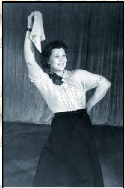
Клавдия Ивановна Шульженко