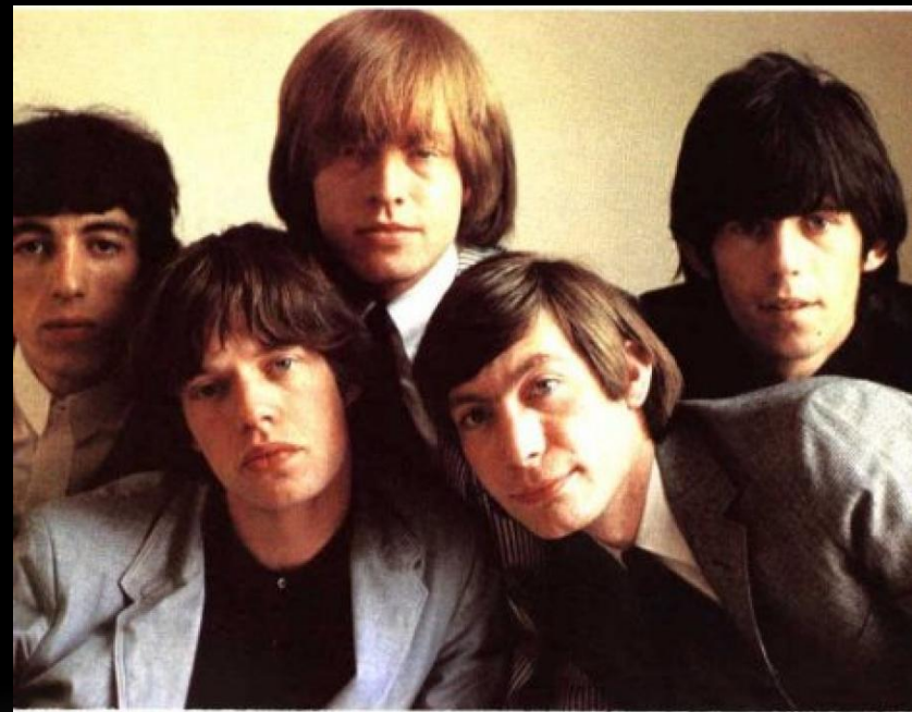
The Rolling Stones