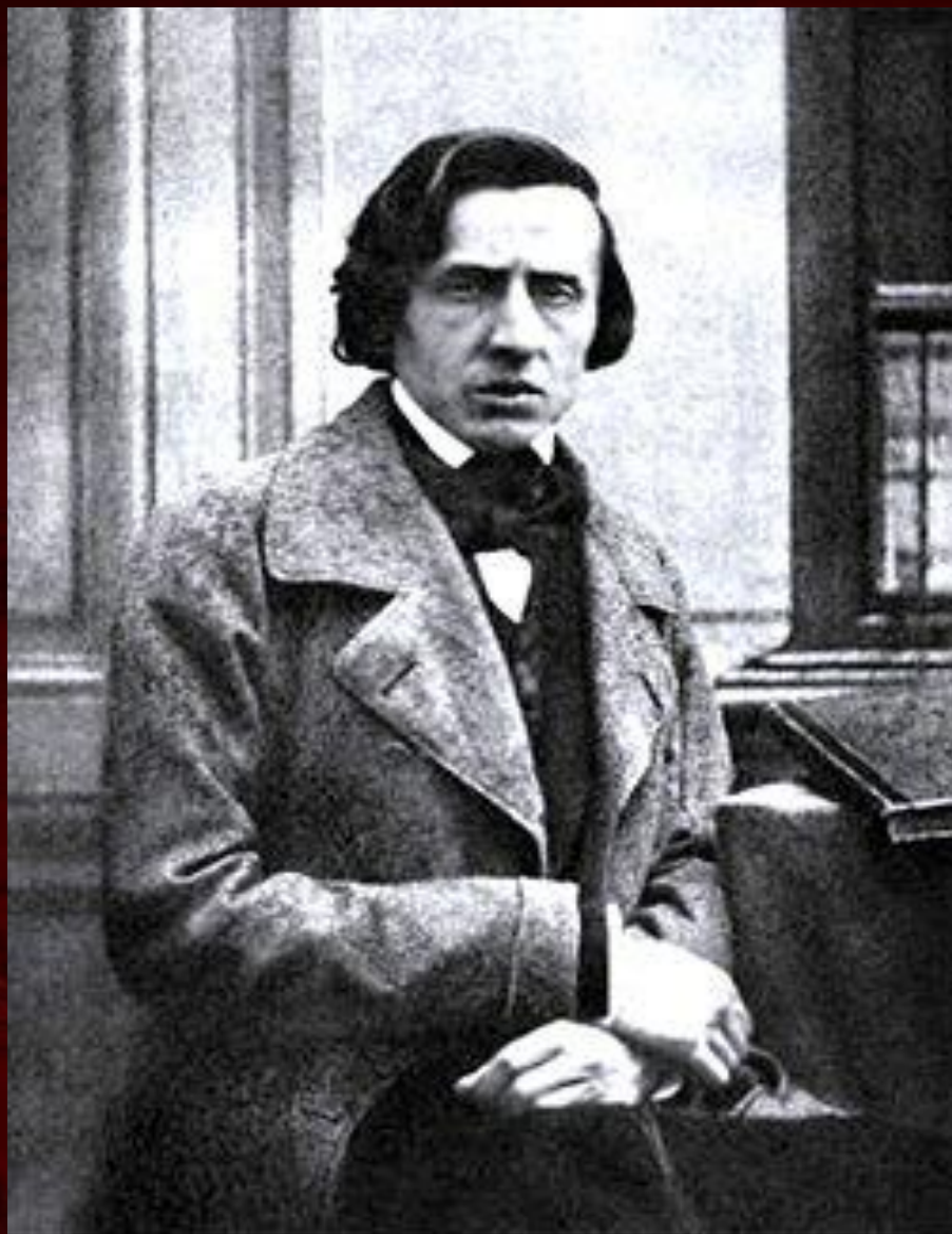
Фридерик Шопен польский композитор (1810-1849)

После Бетховена классицизм уступил место романтизму , и Шопен стал один из главных представителей этого направления в музыке.