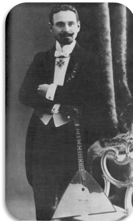
Василий Васильевич Андреев