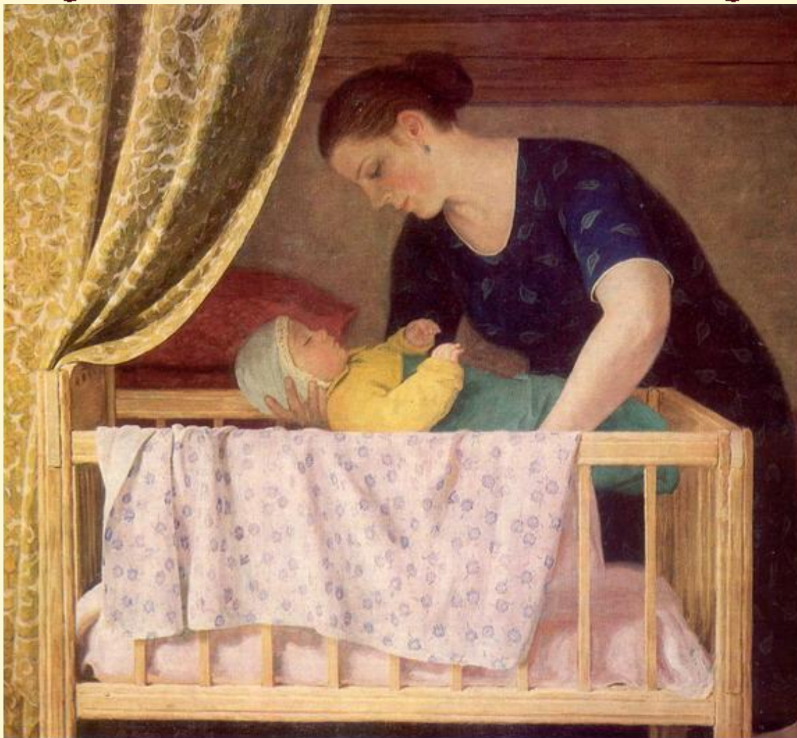
Юрий Петрович Кугач Колыбельная