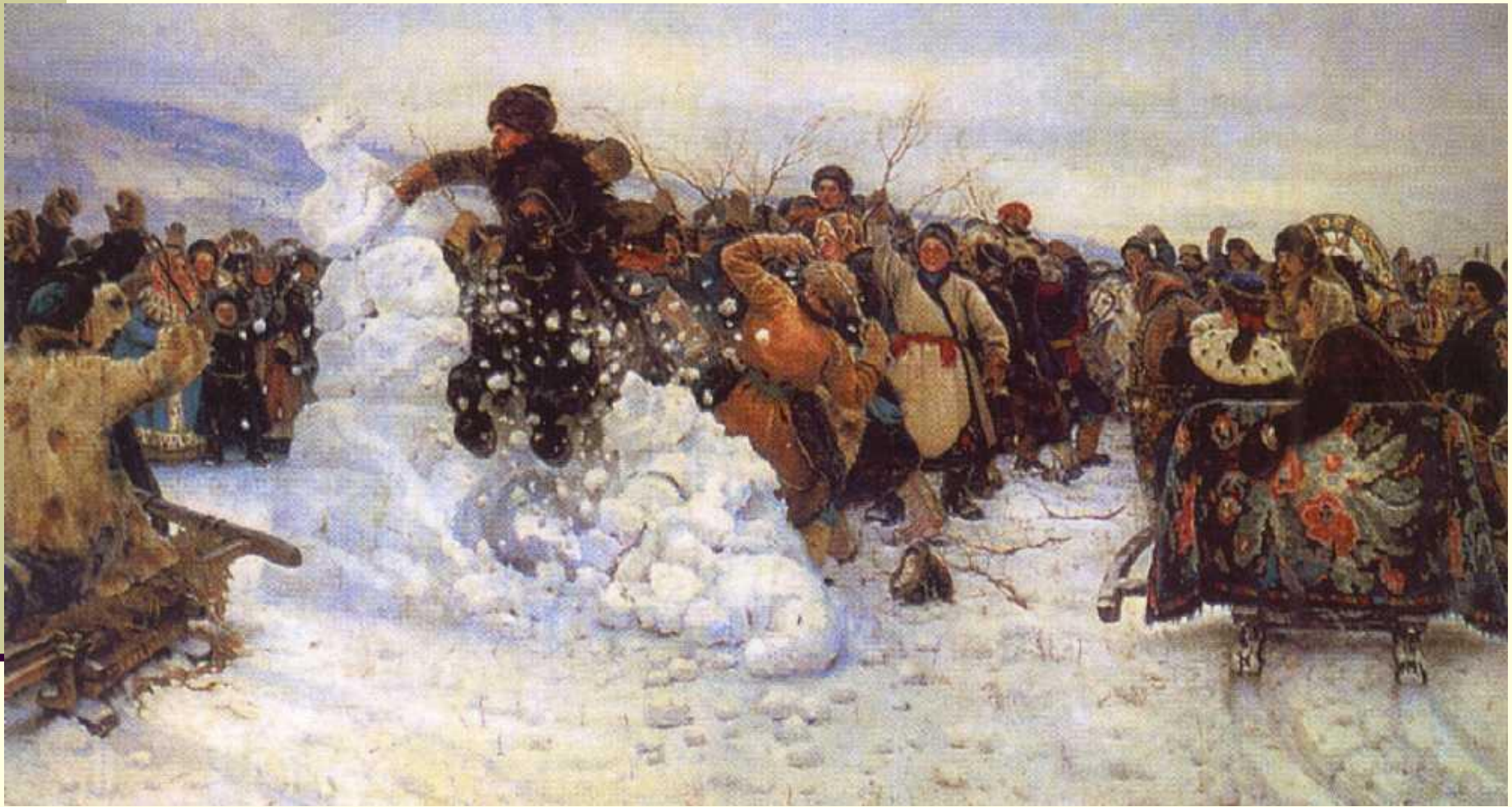
«Взятие снежного городка»