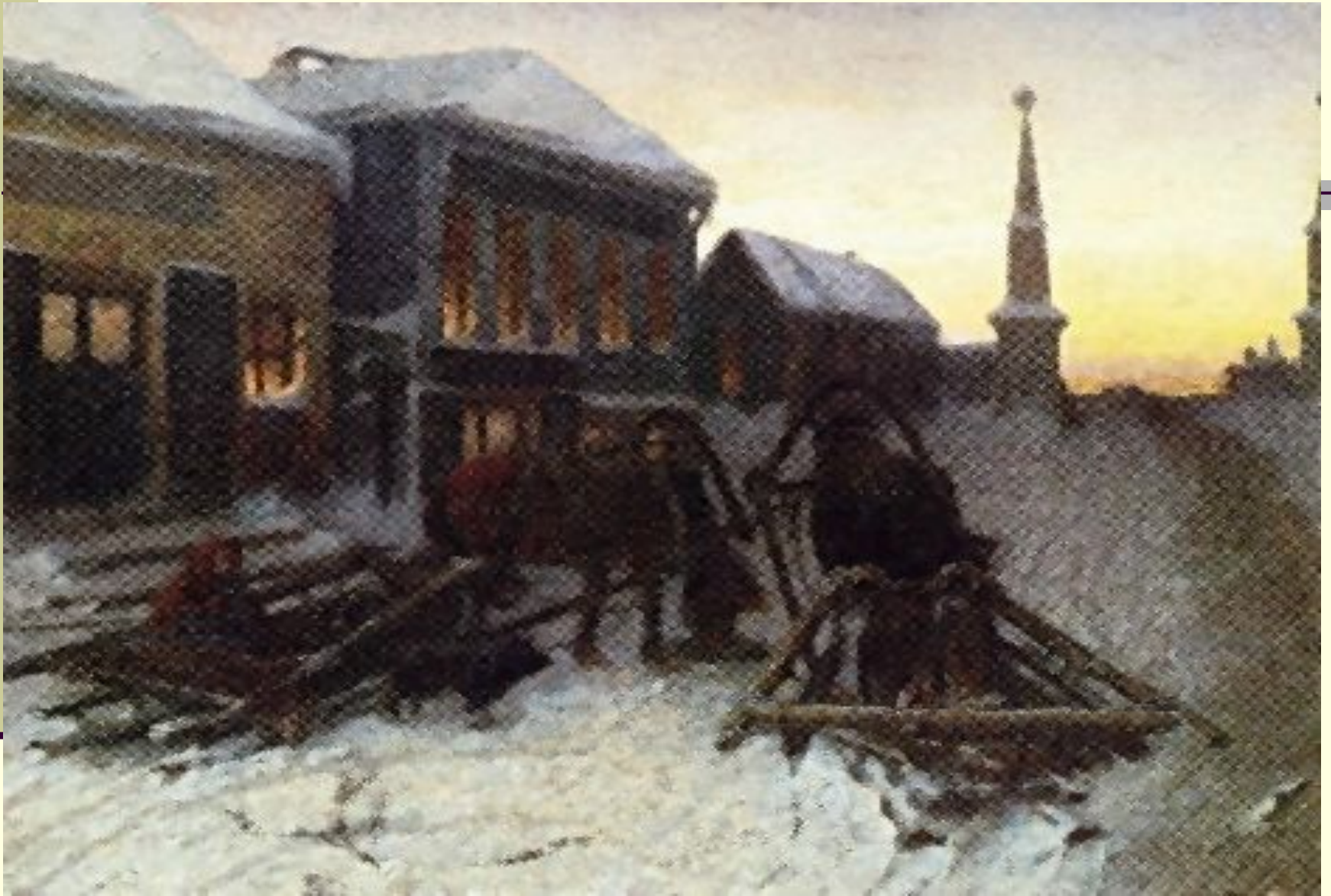
Последний кабак у заставы