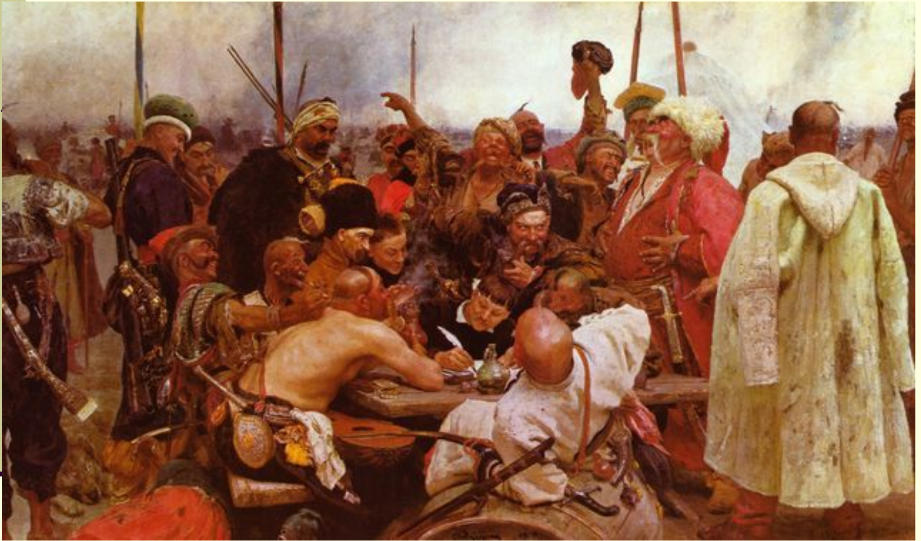
Запорожцы пишут письмо турецкому султану