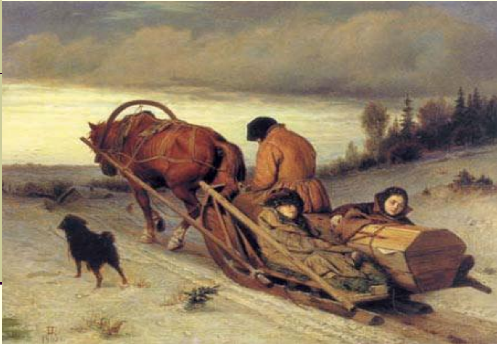
В.Г. Перов « В последний путь»