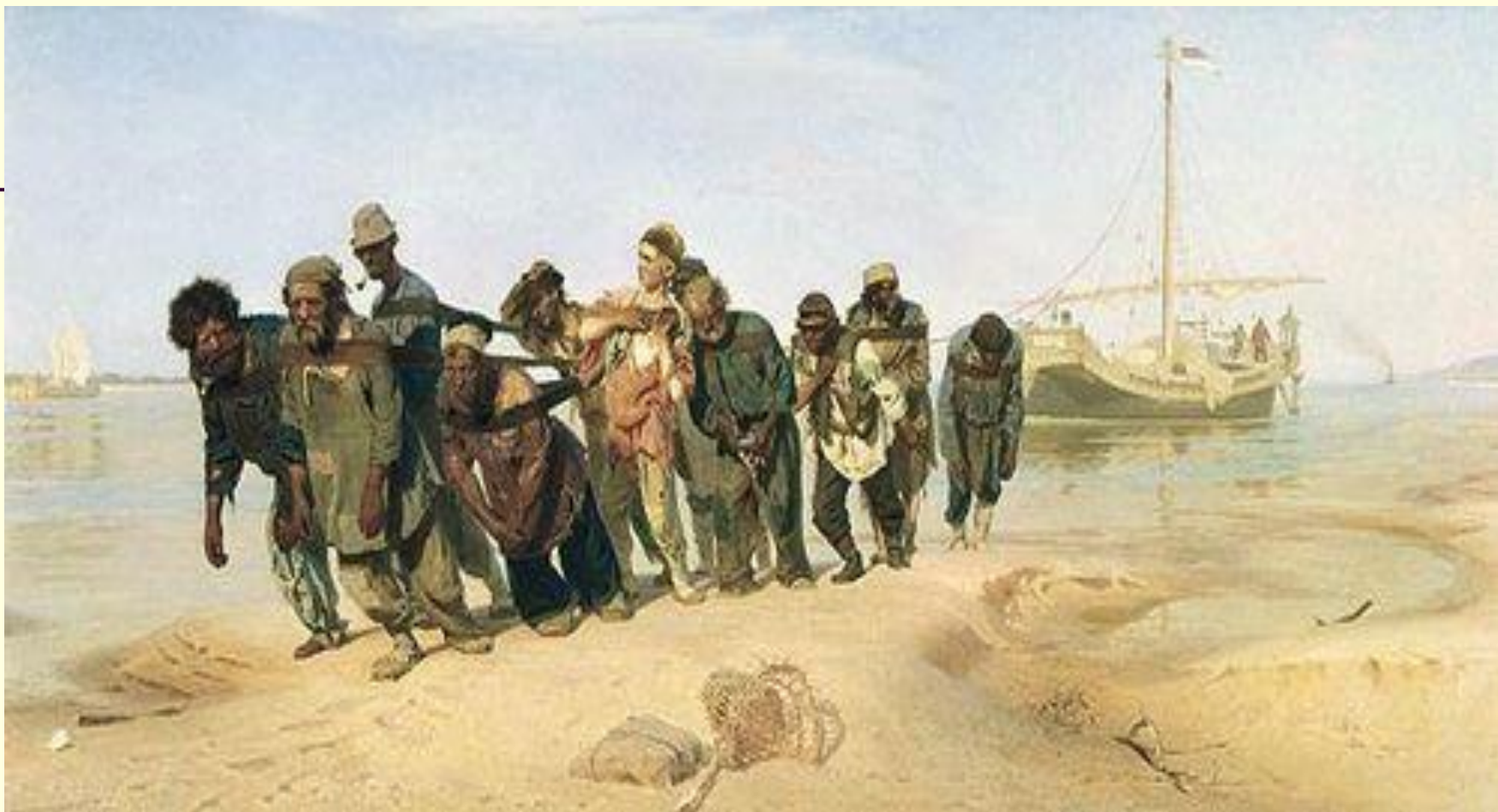
И.Е. Репин « Бурлаки на Волге»