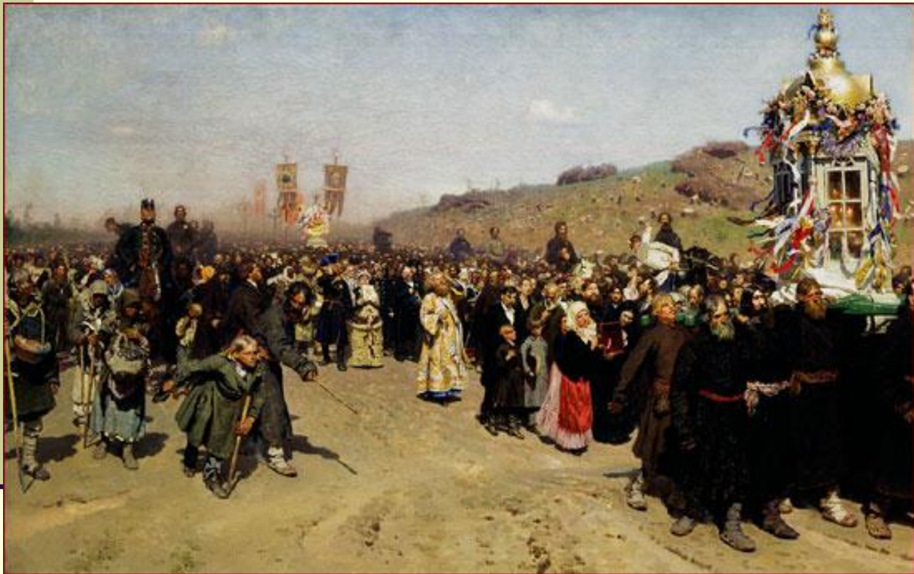
И.Е. Репин «Крестный ход в Курской губернии»