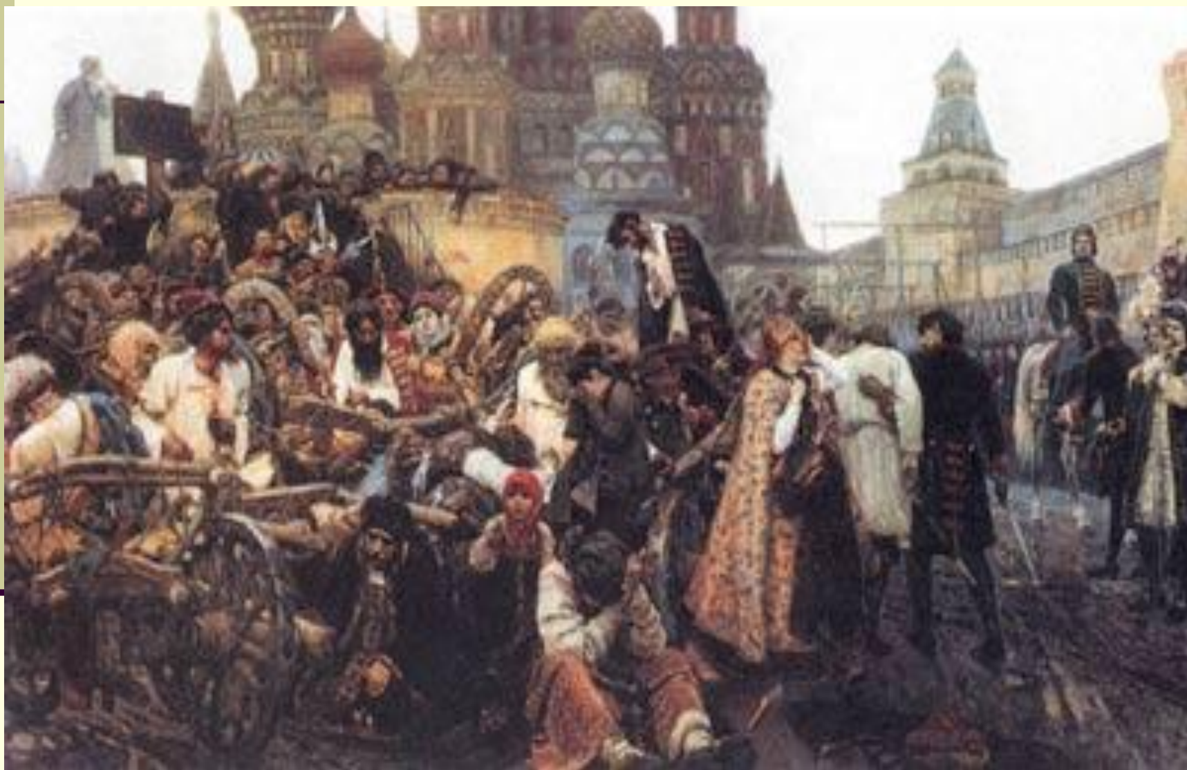
«Утро стрелецкой казни»