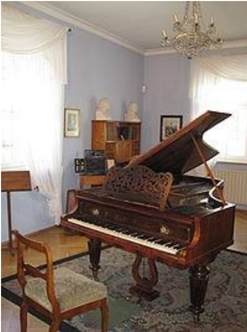
Музыкальная комната композитора в музее Шумана в Цвиккау