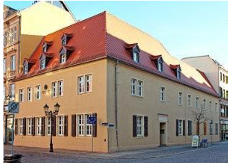
Дом Шумана в Цвиккау