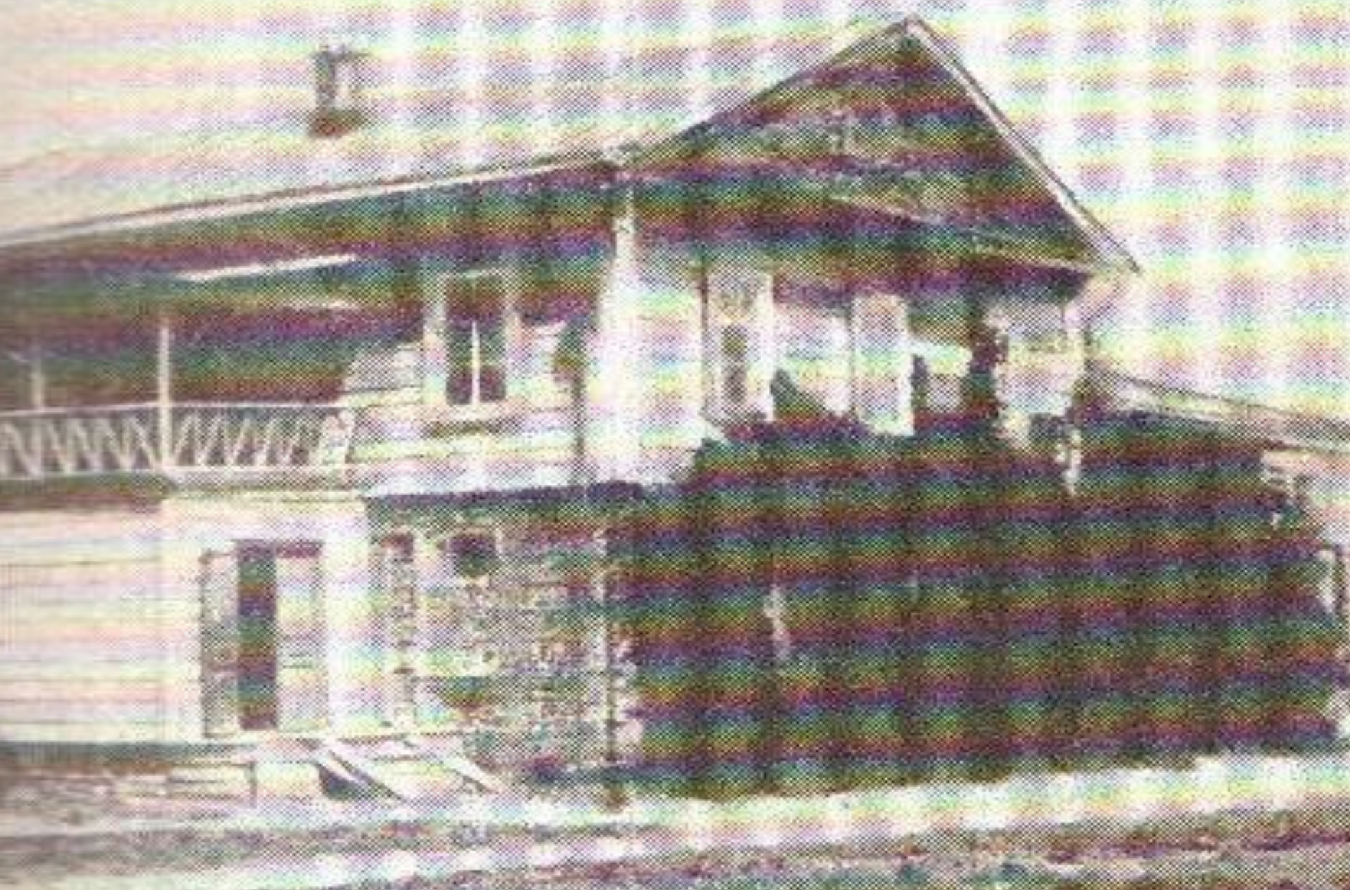
Дом в любимой Ивановке...