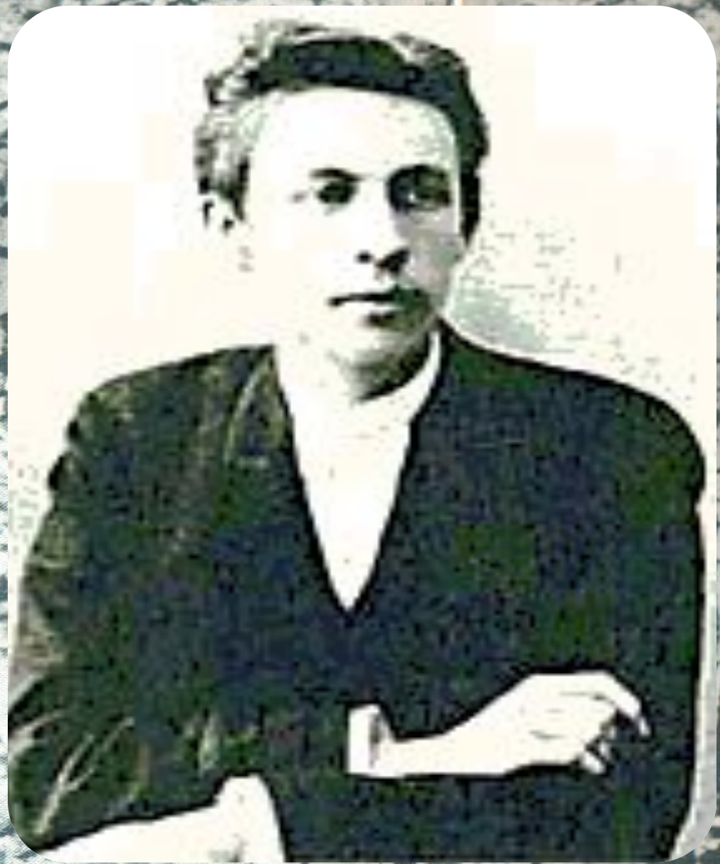
С. В. Рахманинов в молодости.