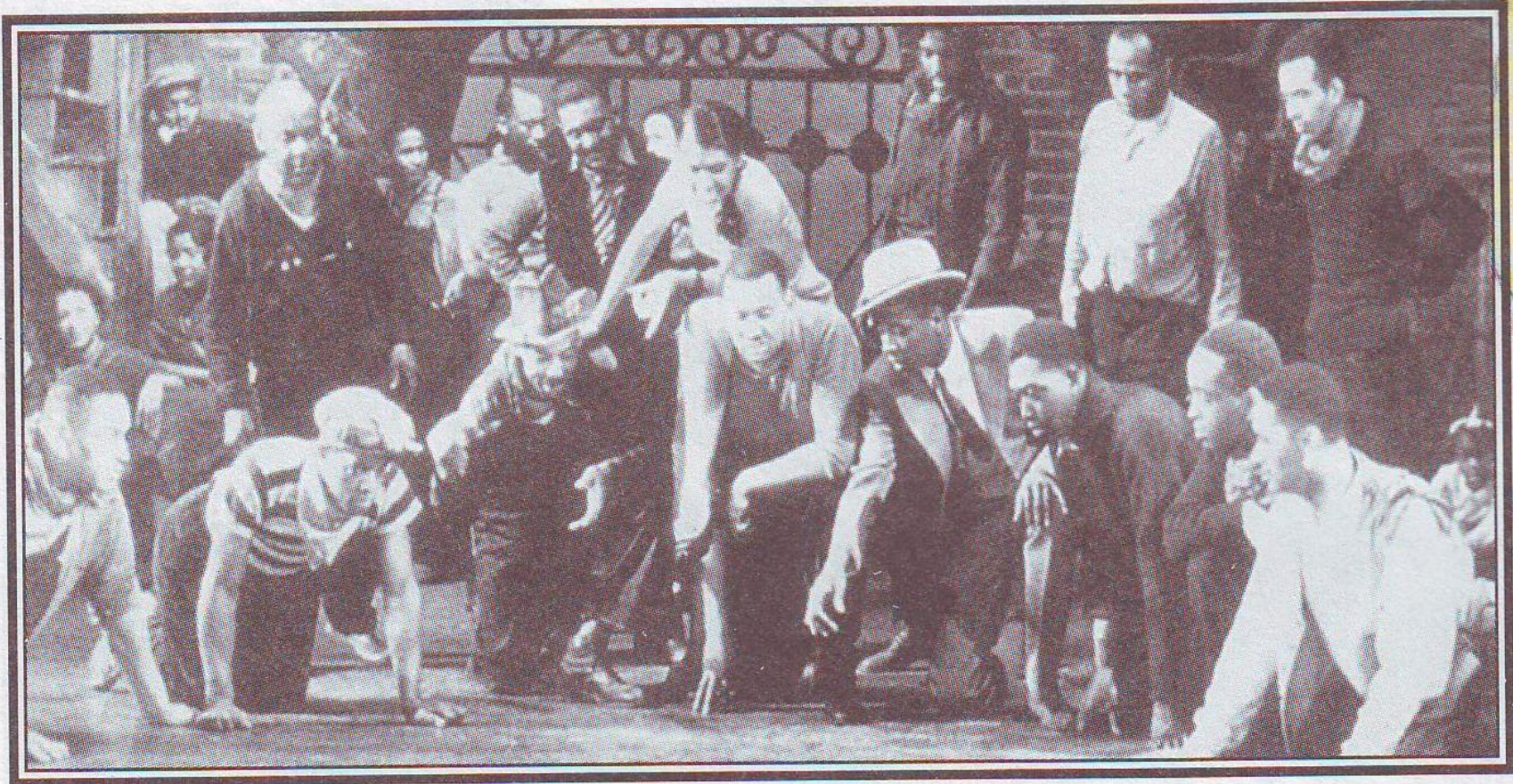
Сцена из оперы «Порги и Бесс», премьера которой состоялась в 1935 году.