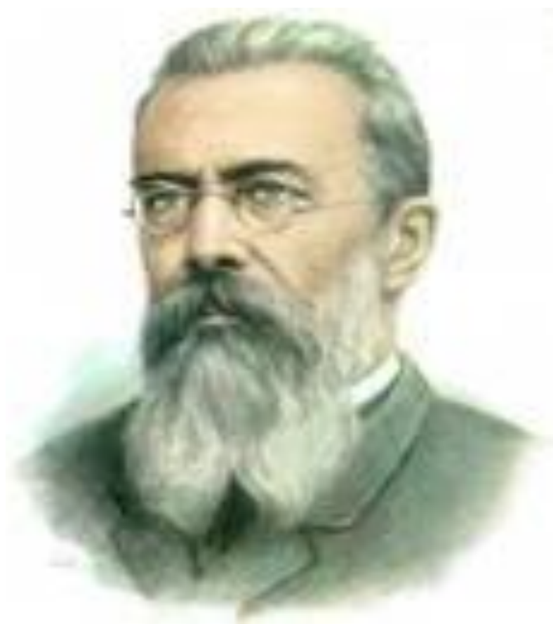
Н.А.Римский - Корсаков