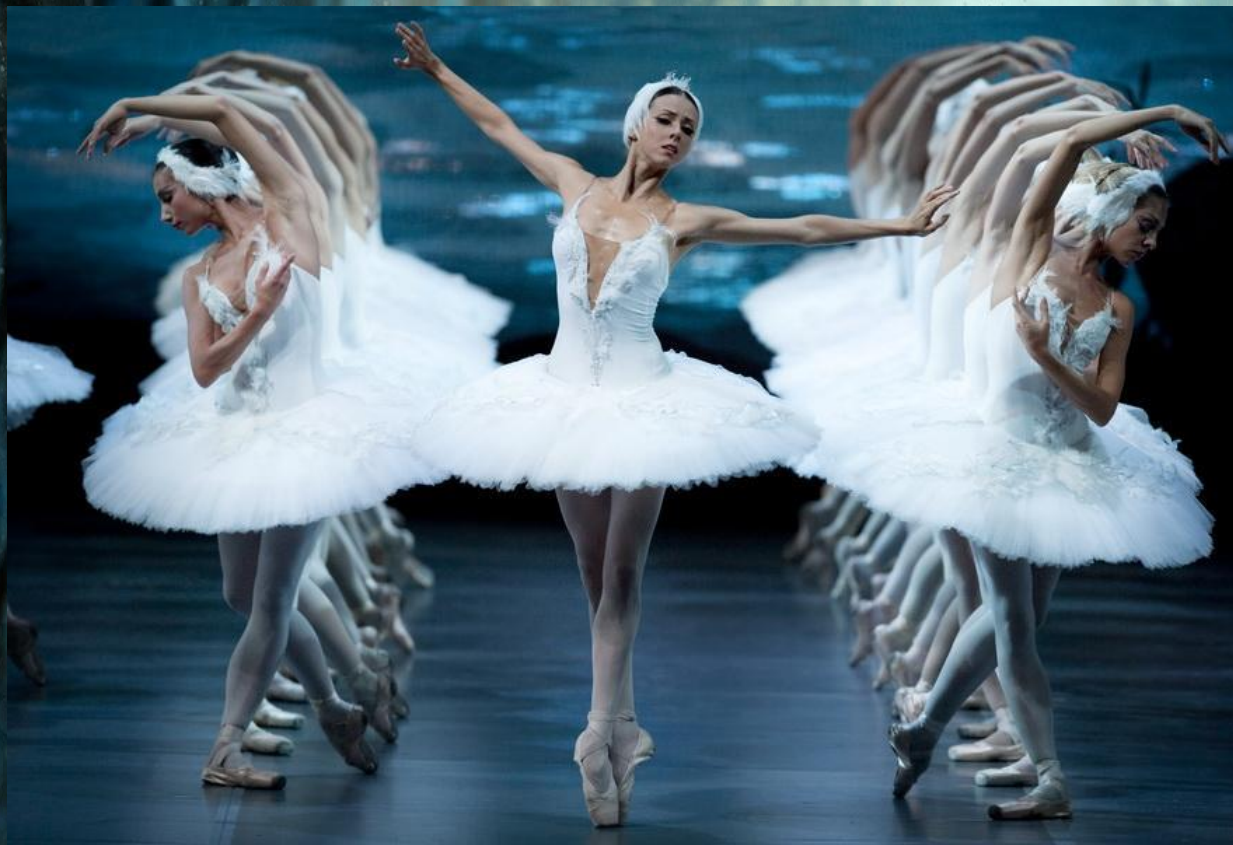
Танец маленьких лебедей