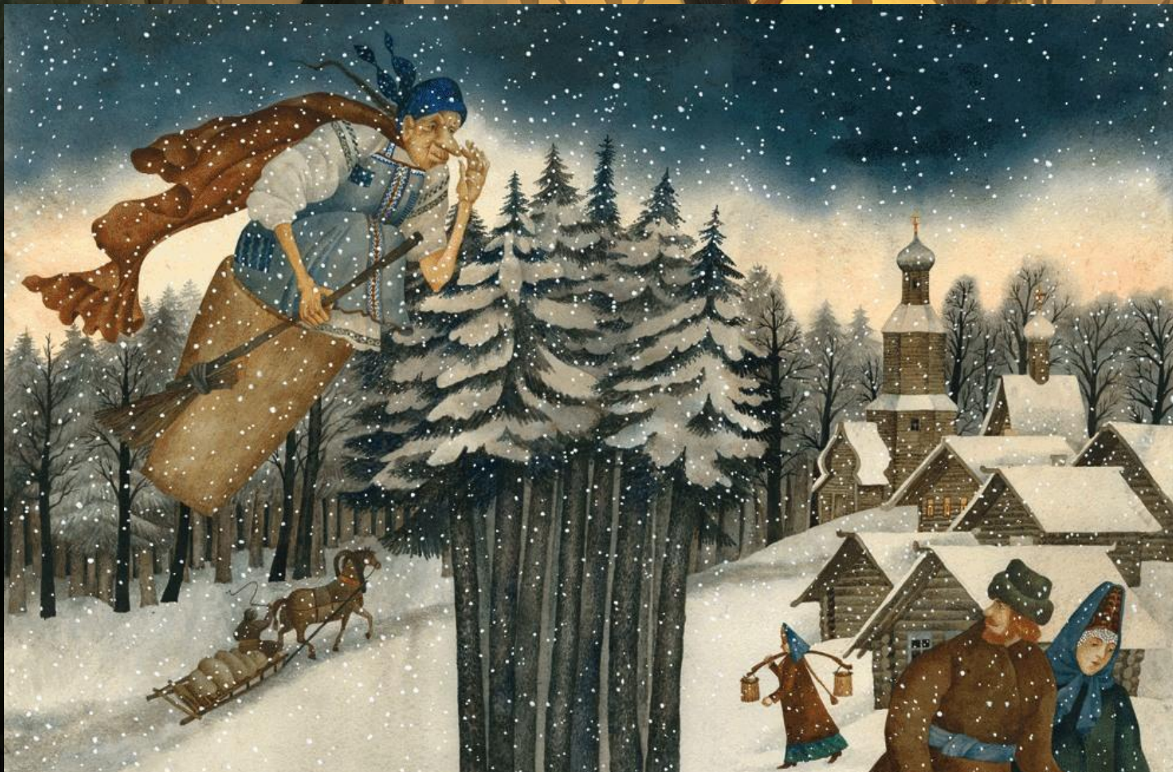
Иллюстрация Веры Павловой