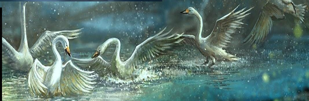
Сцена из балета «Лебединое озеро» Марка из серии «Русский балет»