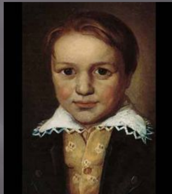
Портрет Бетховена в 13-летнем возрасте

Настоящим учителем Бетховена стал Кристиан Готлоб Нефе. Он познакомил Людвига с творчеством Баха и Генделя. Благодаря Нефе, было издано и первое сочинение Бетховена — вариации на тему марша Дресслера. Бетховену в то время было двенадцать лет, и он уже работал помощником придворного органиста.